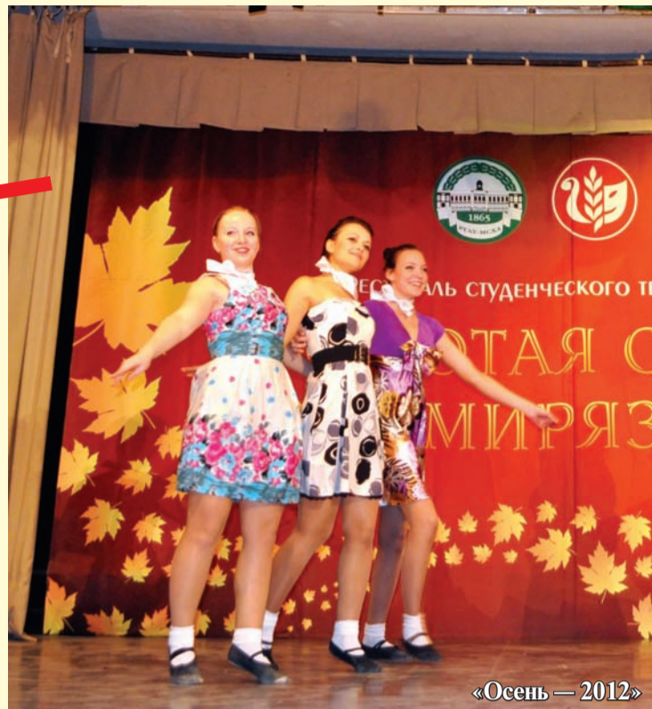
«Осень — 2012»

— Возможность представить факультет, реализовать собственное амплу. Ну, а так же — приятное про-