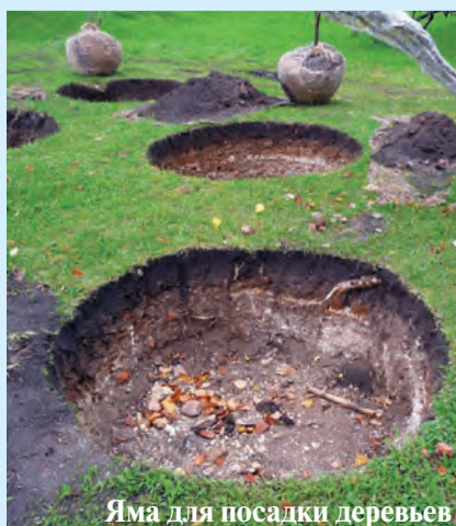
Яма для посадки деревьев