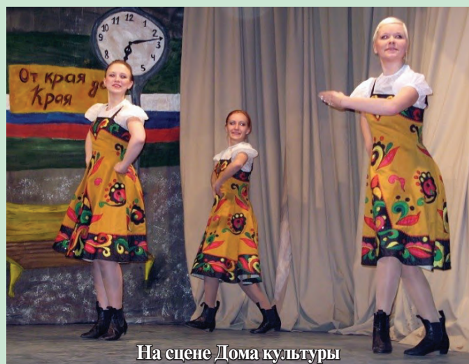
На сцене Дома культуры