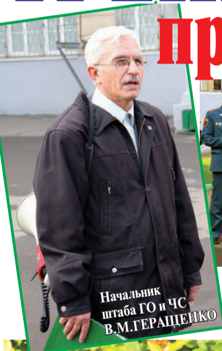
Начальник штаба ГО и ЧС В.М. ГЕРАЩЕНКО