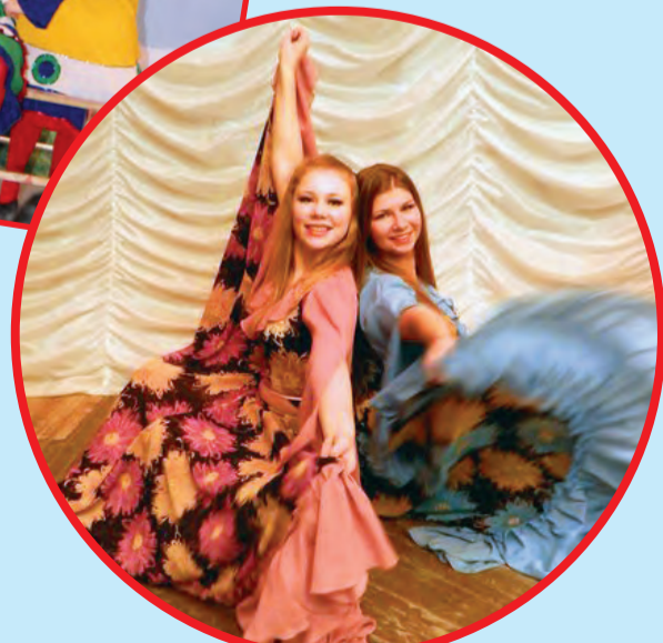
Интервью провела Вера ЖЕЛЕЗНАЯ. Председатель культмассовой комиссии прфкома студентов