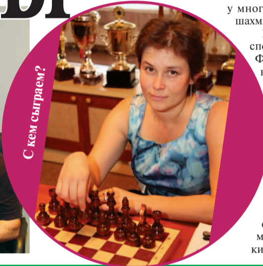
С кем сыграем?

у многих вызвала игра в быстрые шахматы.