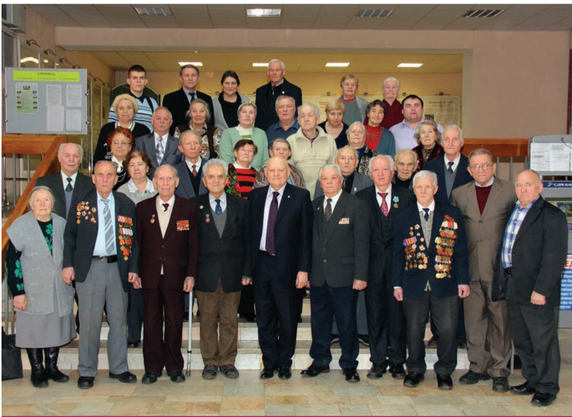
После конференции ветераны сфотографировались на память

Редакция газеты, читатели, коллеги ученого заранее благодарят своего учителя и товарища, поздравляя его с днем рождения.