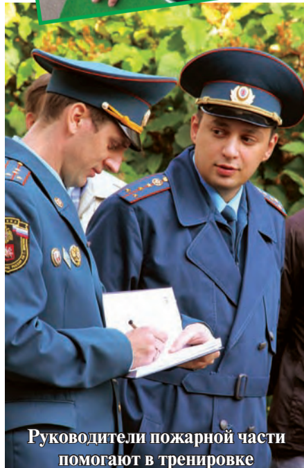
Руководители пожарной части помогают в тренировке