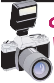
ФОТО-репортаж с соревнований

Успешно прошла в университете в третий раз спартакиада «Здоровье» профессорско-преподавательского состава и сотрудников по шахматам, баскетболу, волейболу, мини-гольф, дартсу, плаванию, настольному теннису, футболу.