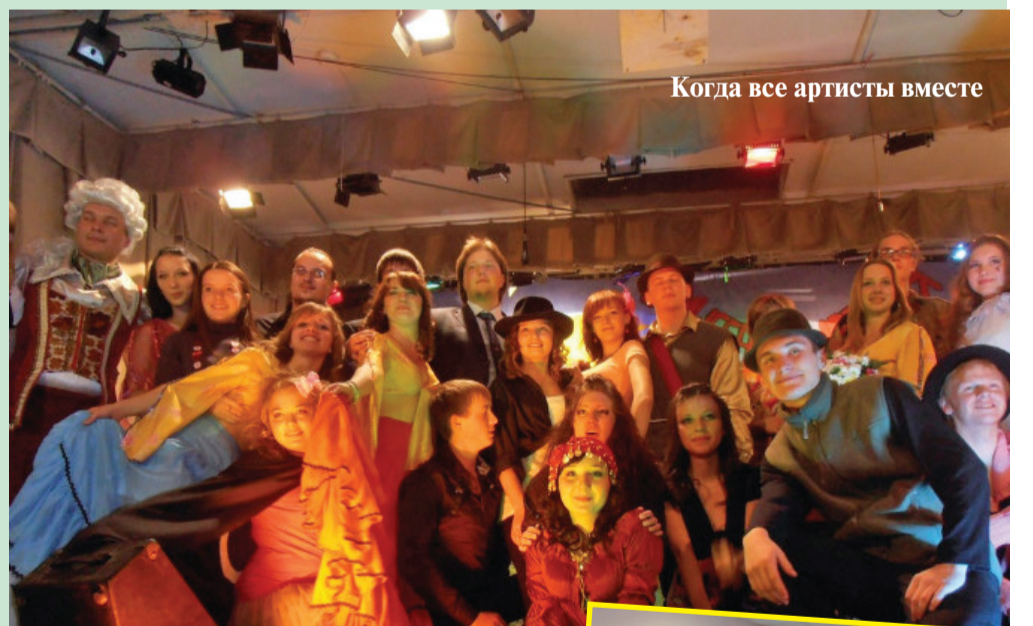
Когда все артисты вместе

С культоргамы мы поговорили и о том, чтобы они хотели внести нового в культурную жизнь академии. И выяснилось, многие за то, чтобы организовывать конкурсы «Мистер Тимирязевки», они предложили проводить и творческие конкурсы, как «Две Звезды» (преподаватель + студент), «День рождения Академии» и всевозможные «Квесты», так называемые флеш мобы.