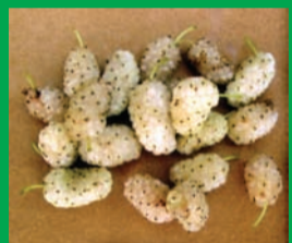
Перспективная форма шелковицы «Радость»

Основная тема его научных исследований: «Введение в культуру и создание сортов малораспространенных плодовых пород», а также разработка на их основе натуральных поливитаминных напитков, играющих важнейшую роль для здоровья человека.