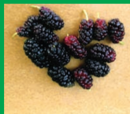
Перспективная форма шелковицы «Мечта»

Ежегодно 20 октября наша страна отмечает День рождения ее Военно-морского флота. В этом году он будет триста шестнадцатым. Как известно, начало созданию регулярного военного флота России положено в 1696 году, когда по указу Петра I началось строительство Азовского флота.