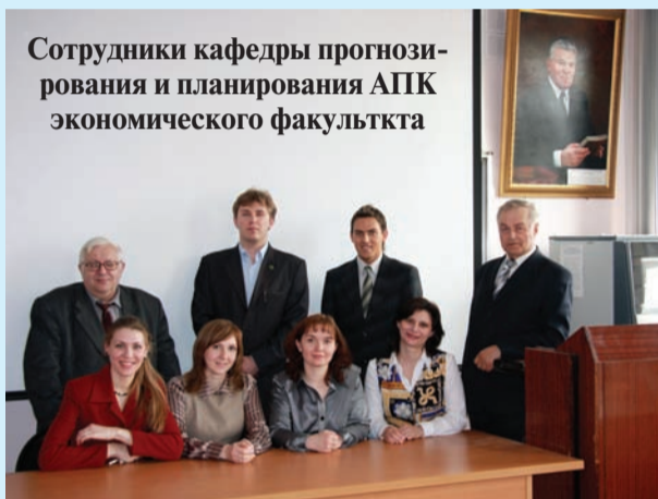
Сотрудники кафедры прогнозирования и планирования АПК экономического факультета

Н.В. ПАНКОВ, Председатель Комитета по аграрным вопросам Государственной Думы Российской Федерации, кандидат экономических наук