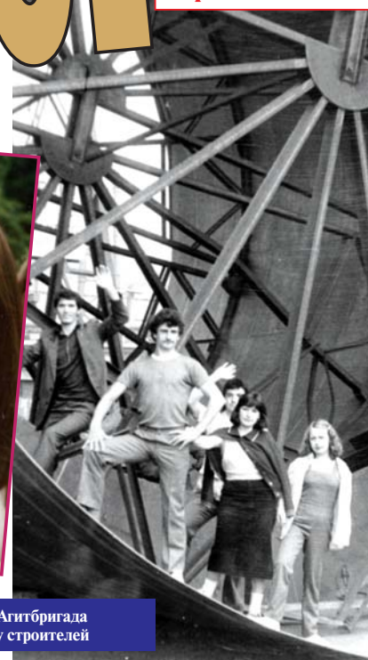
Агитбригада у строителей

ления коллективов из Словакии, Польши, Белоруссии и Украины, Воронежа. Ребята из Калужского филиала РГАУ – МСХА имени К.А. Тимирязева также участвуют в нашем фестивале.