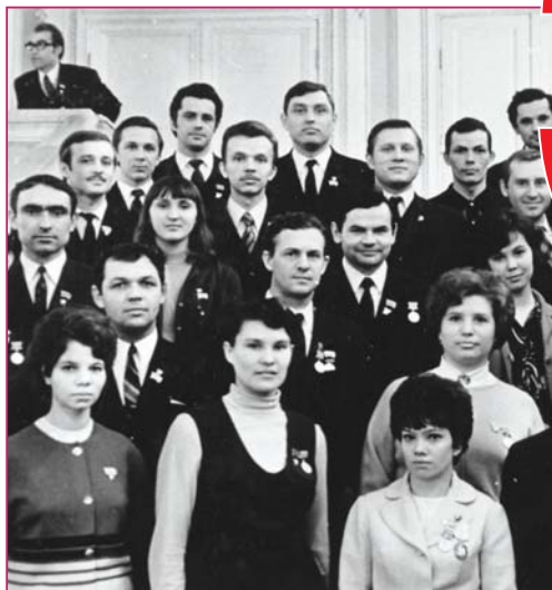
Делегаты конференции Московской городской организации ВЛКСМ. Март, 1972