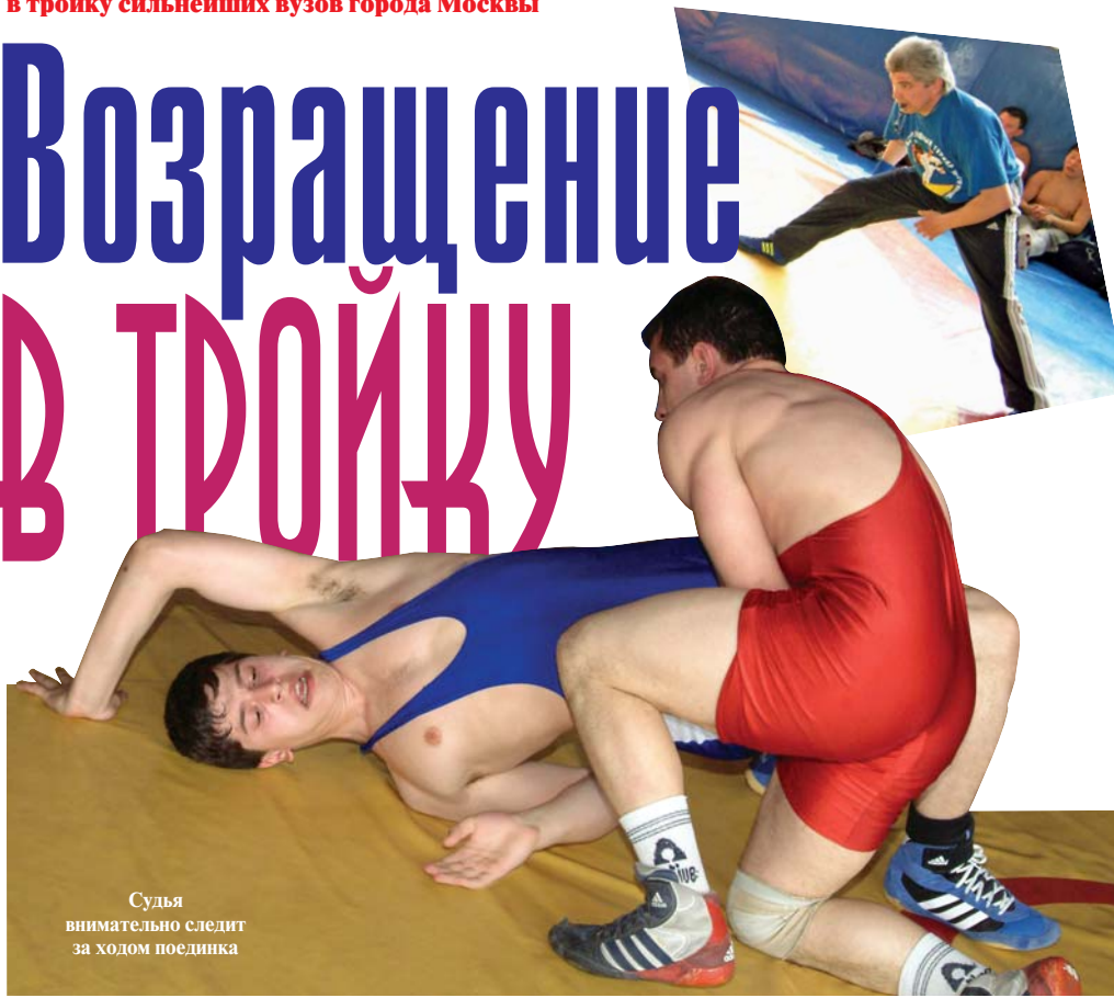
Судья внимательно следит за ходом поединка