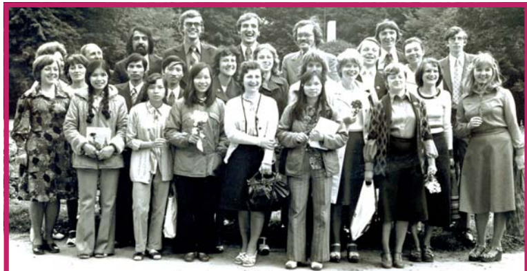
Иностранные студенты, обучавшиеся в ТСХА. Август 1977 г.

Мнение редакции может не совпадать с мнением автора