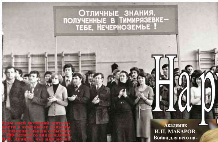
Годы моей активной деятельности в комсомоле связаны со знаменательным событием — 100-летием со дня рождения В.И. Ленина, чье имя носит союз молодежи. Этому предшествовала серьезная подготовка во всех комсомольских организациях страны и на всех уровнях. По существу это был смотр комсомола, отчет о его работе, получивший название «Всесоюзный Ленинский зачет».

Поставленная задача воспитывать у студентов ответственное отношение к учебе, умение работать систематически, рационально использовать время всегда находилась в центре внимания комсомольской организации Тимирязевки, выполнялась в условиях товарищеской взаимопомощи и выскателности. Большое внимание в деятельности комсомола уделялось работе