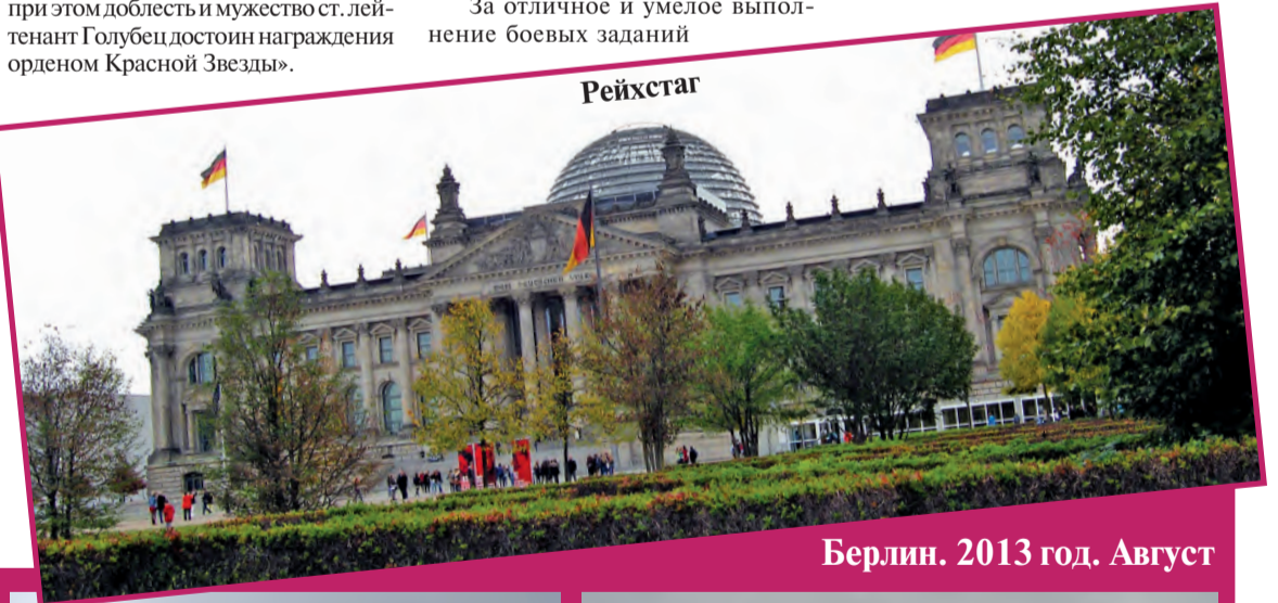
Берлин. 2013 год. Август