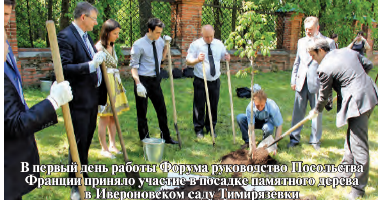
В первый день работы Форума руководство Посольства Франции приняло участие в посадке памятного дерева в Ивероновском саду Тимирязевки