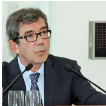
Выступает Посол Франции Жан Морис РИППЕР

20-21 мая в РГАУ—МСХА имени К.А.Тимирязева состоялся III Российско-Французский Форум в области аграрного образования и науки, проведенный на основании Постановления Правительства Российской Федерации ДМ-П2-8522 от 26.11.2013 и по поручению Министерства сельского хозяйства Российской Федерации.