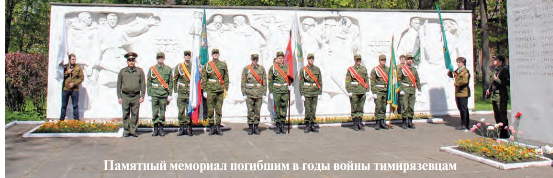
Памятный мемориал погибшим в годы войны тимирязевцам