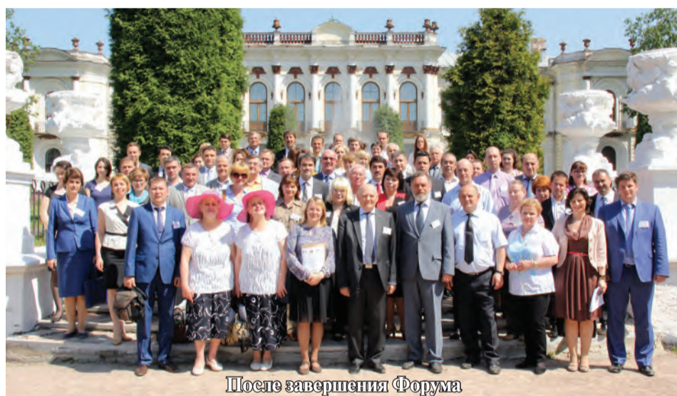
После завершения Форума