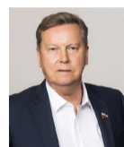
Первый заместитель председателя комитета Олег Анатольевич Нилов