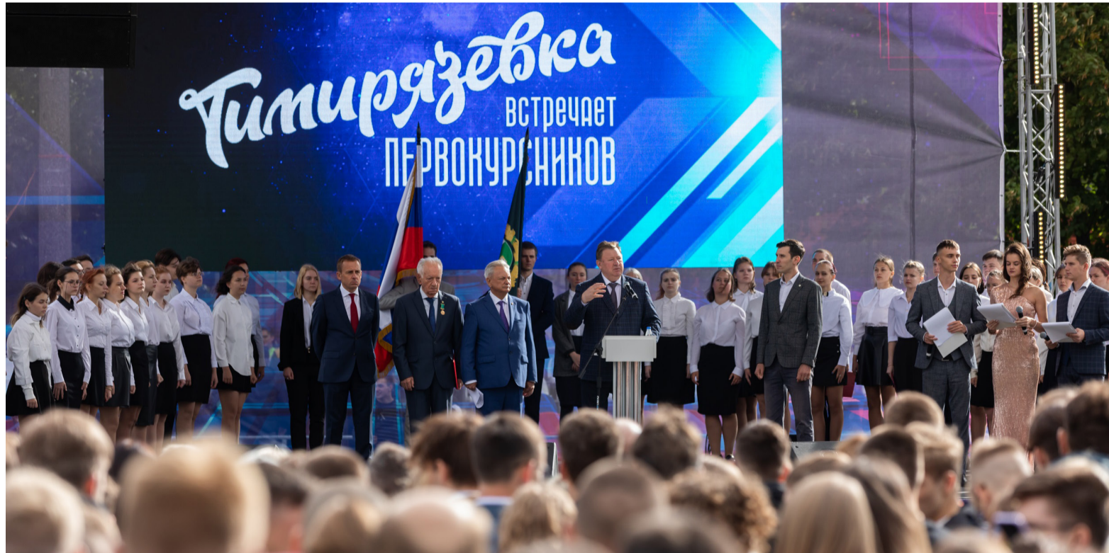
В.И. Кашин приветствует более 4000 первокурсников университета.

Председатель Комитета Государственной Думы по аграрным вопросам Владимир Кашин пожелал юношам и девушкам быть достойными последователями великих ученых Климента Аркадьевича Тимирязева, Николая Ивановича Вавилова, Василия Робертовича Вильямса, Сергея Петровича Смелова, выдающихся агрономов, луговодов, зоотехников, экономистов и представителей других науч-