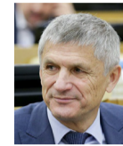
Алексей Федорович Лавриненко