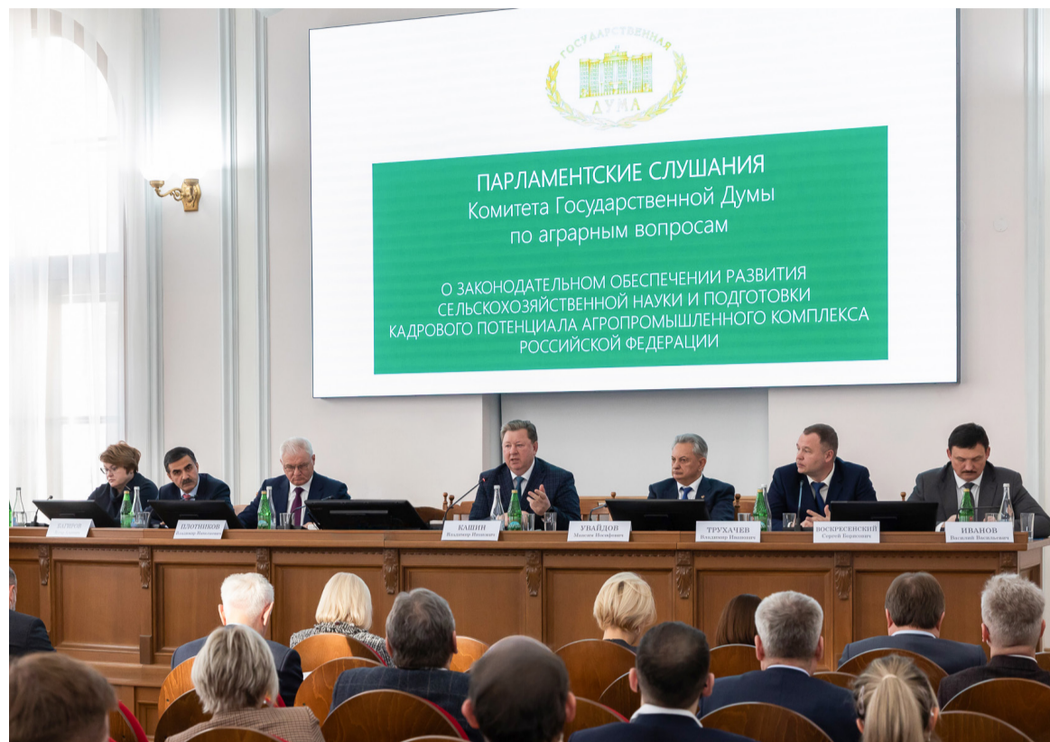
Участники первых в истории парламентских слушаний в Тимирязевской академии. 2022 год.