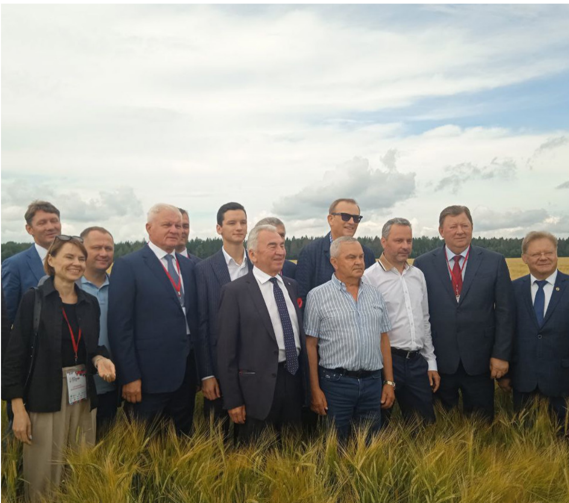
Фото с участием членов Комитета Государственной Думы по аграрным вопросам.

В истории так повелось, что науке доверяют, она является основным источником знаний. И слово, и дело, идущее от научного коллектива, ценится. Важно по жгучим направлениям развития АПК иметь экспертное мнение науки. И еще ценнее, когда она является главным двигателем всего нового и передового, а не плетется в конце лучших практик.