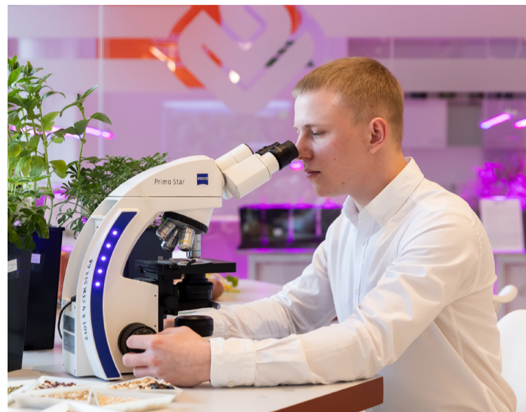
Молодой исследователь в образовательном центре «Продимекс».

Быть ученым – это большая ответственность. Многие начинающие специалисты сталкиваются