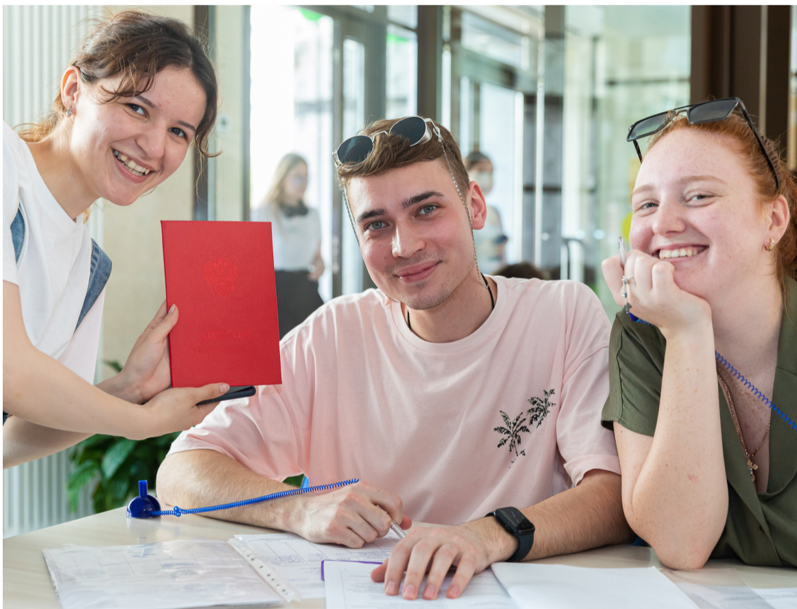
Приемная кампания-2024 стала одной из самых успешных в истории университета.

Поступить в университет и сразу получить востребованную работу – звучит как заветная мечта любого абитуриента. Для более чем 400 студентов, магистрантов и аспирантов Тимирязевской академии мечта стала явью – они воспользовались предложениями от крупнейших агрокомпаний и отраслевых ведомств и выбрали целевое обучение. Для вуза этот показатель рекордный, ведь по сравнению с прошлым годом целевой набор увеличился в 6 раз, а сам процесс поступления для «целевиков» стал понятнее и удобнее благодаря новым правилам.