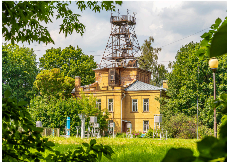
Историческое здание Метеообсерватории имени В.А. Михельсона.