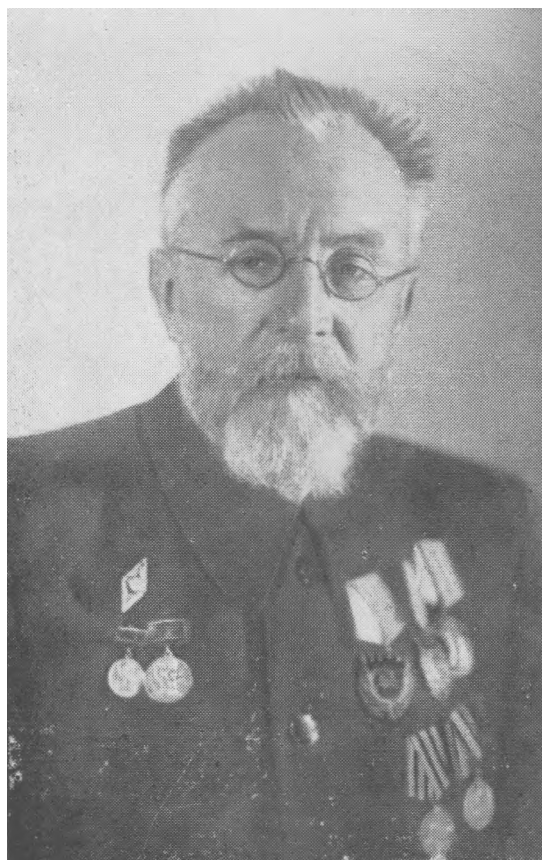
Сирог. С. Саврасов