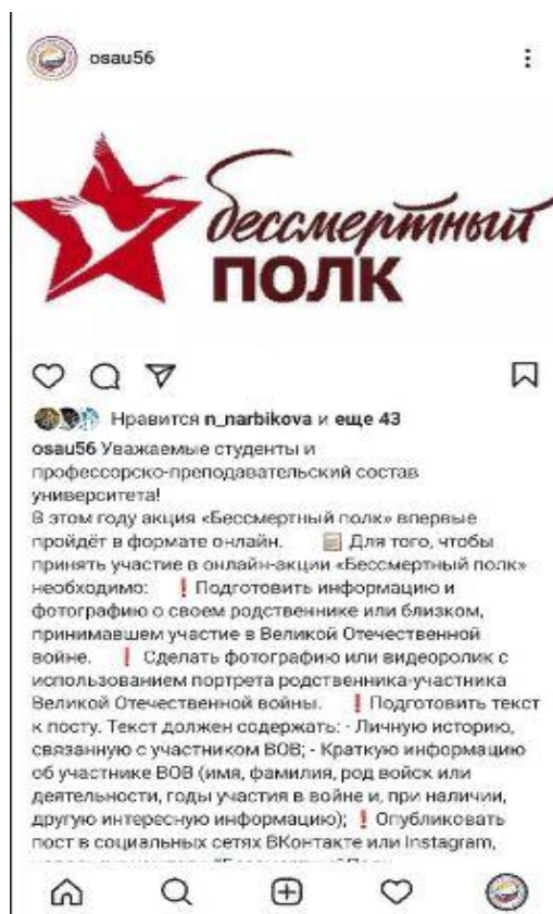
Рис. 3. Акция «Бессмертный полк» онлайн

Рассмотрим пример на рисунке 3. В рамках формирования у обучающихся чувства патриотизма и гражданственности, чувства уважения к памяти защитников и подвигам героев Отечества в 2020 году впервые была проведена акция «Бессмертный полк» в онлайн формате, где студенты готовили информацию о своих родственниках и близких, принимавших участие в Великой Отечественной Войне, делали фото или видео материал, а далее выкладывали всю информацию в социальные сети с хэштэгами акции и