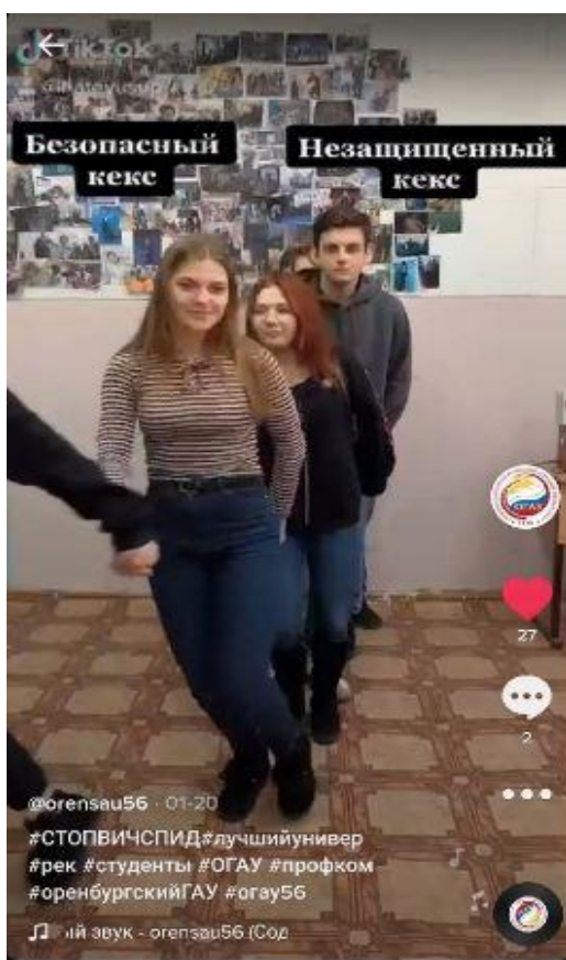
Рис. 1. Студенты в рамках акции #СТОПВИЧСПИД

Рассмотрим пример на рисунке 1. Студенты сняли полезный видеоконтент, участвуя в конкурсе на лучшую информационную работу в рамках акции #СТОПВИЧСПИД, используя тренды ТикТока. Формат коротких видеороликов, который используется в Tiktok, помог студентам изучить проблему, понять её и найти пути решения.