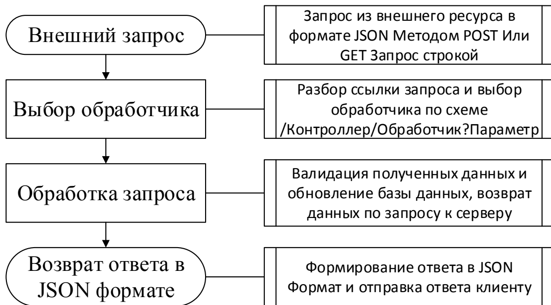
Рис. 2. Схема работы RESTful API сервера

Так как React JS является асинхронным, то есть часть программного кода может запуститься и дать «обещание» основному коду, что он вернет результат по окончании выполнения своей части, возникает проблема, что изменения данных состояний необходимо контролировать. Асинхронность наиболее часто используется как раз таки при использовании внешних API, которые взаимодействуют со сторонним сервером. Таким образом, клиентское приложение обрисовывает интерфейс сразу же после получения «обещаний» от кода, который взаимодействует с API, а уже после получения «обещанных» данных обновляет только ту часть приложения, к которым относятся полученные данные. Упрощенная схема работы подобного клиентского приложения изображена на рисунке 2. [4].