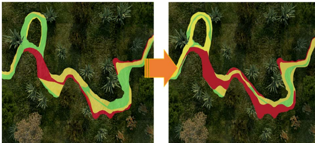
Рис. 2. Фактический и прогнозный сценарии изменения загрязнения участка р. Пехорка

данных в модуле ГЕОМОДЕЛЬ и с помощью дополнительных инструментов в программе AutoCad нанесены недостающие составляющие [2, 3]. На выходе были получены два сценария по загрязнению реки биогенными элементами (рисунок 2):