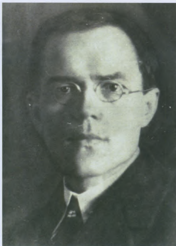
Николай Дмитриевич Кондратьев