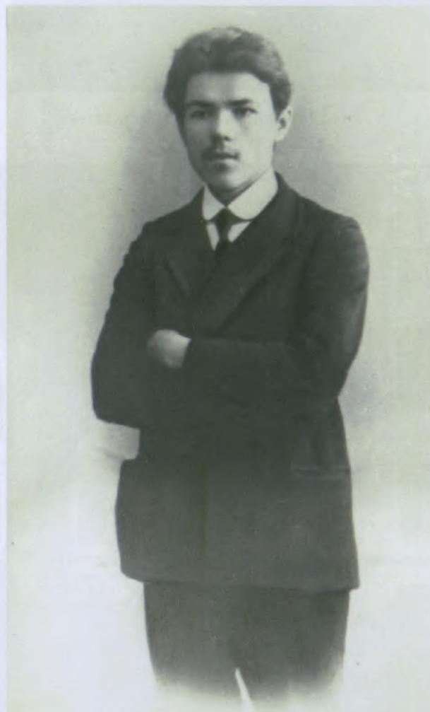
Кондратьев Николай Дмитриевич. 1911 г.