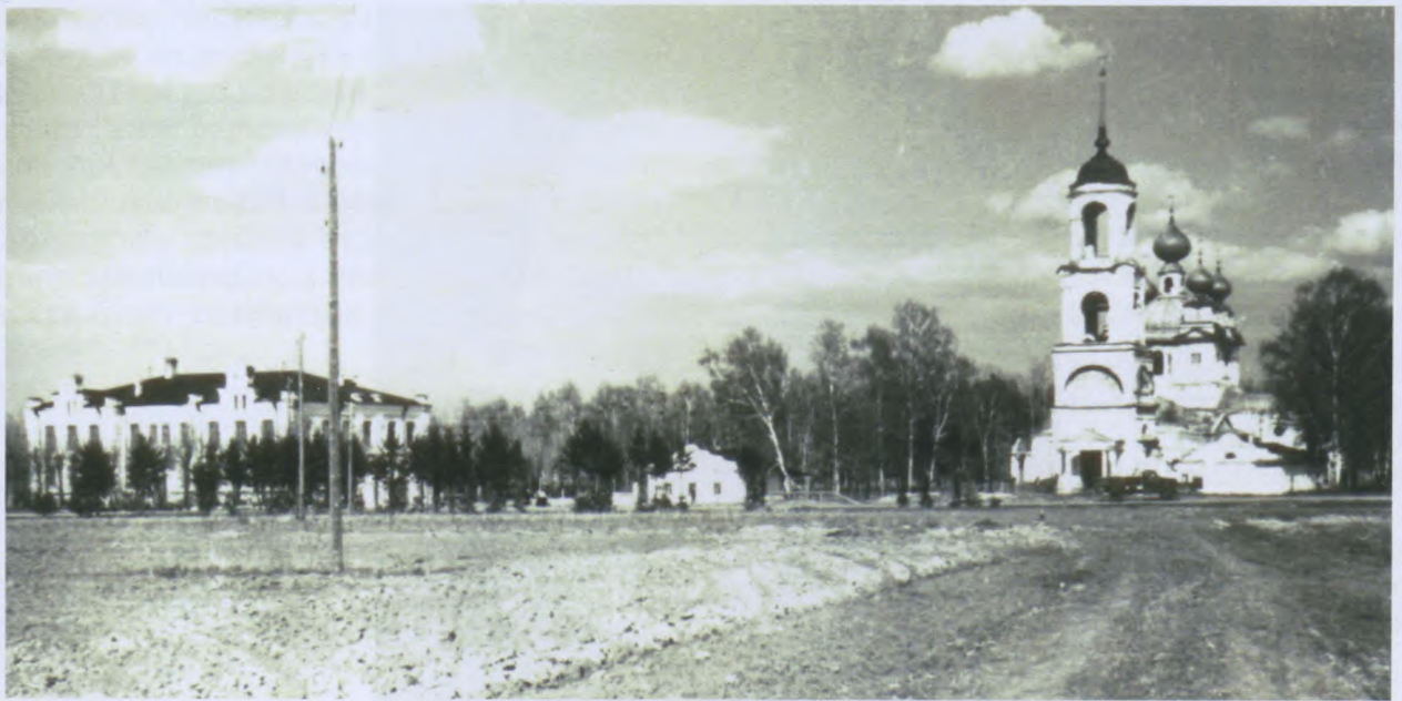
Церковь в Хренове