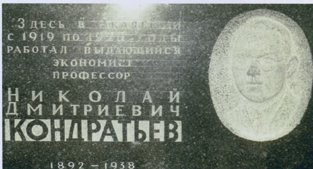
Памятная доска Николаю Дмитриевичу Кондратьеву. РГАУ-МСХА имени К.А. Тимирязева, 2 корпус