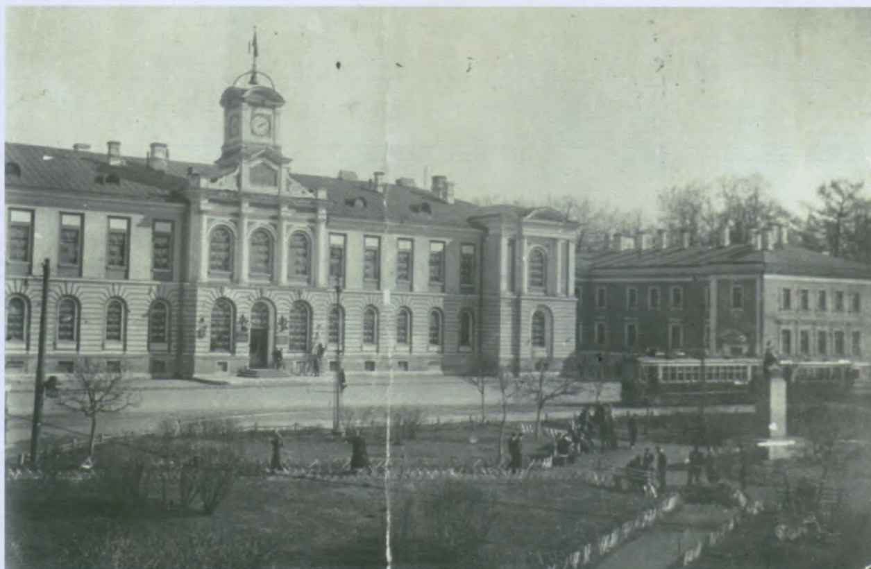
Тимирязевская (Петровская) сельскохозяйственная академия. Первая половина 20-х гг.