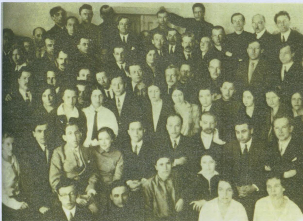
Прощальный снимок Н.Д. Кондратьева (второй ряд, пятый слева) с сотрудниками Конъюнктурного института. 1928 (1929) г. Последняя из известных его фотографий