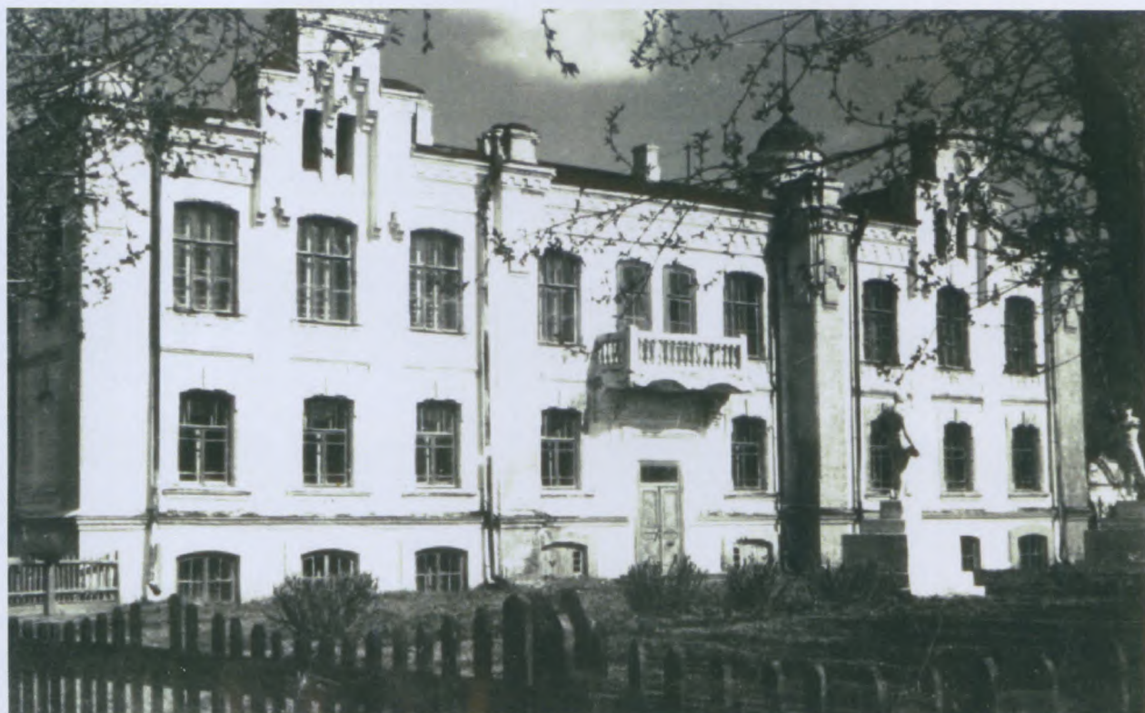
Хреновская церковно-учительская семинария