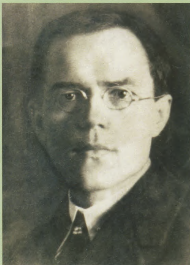
Николай Дмитриевич Кондратьев 1892-1938