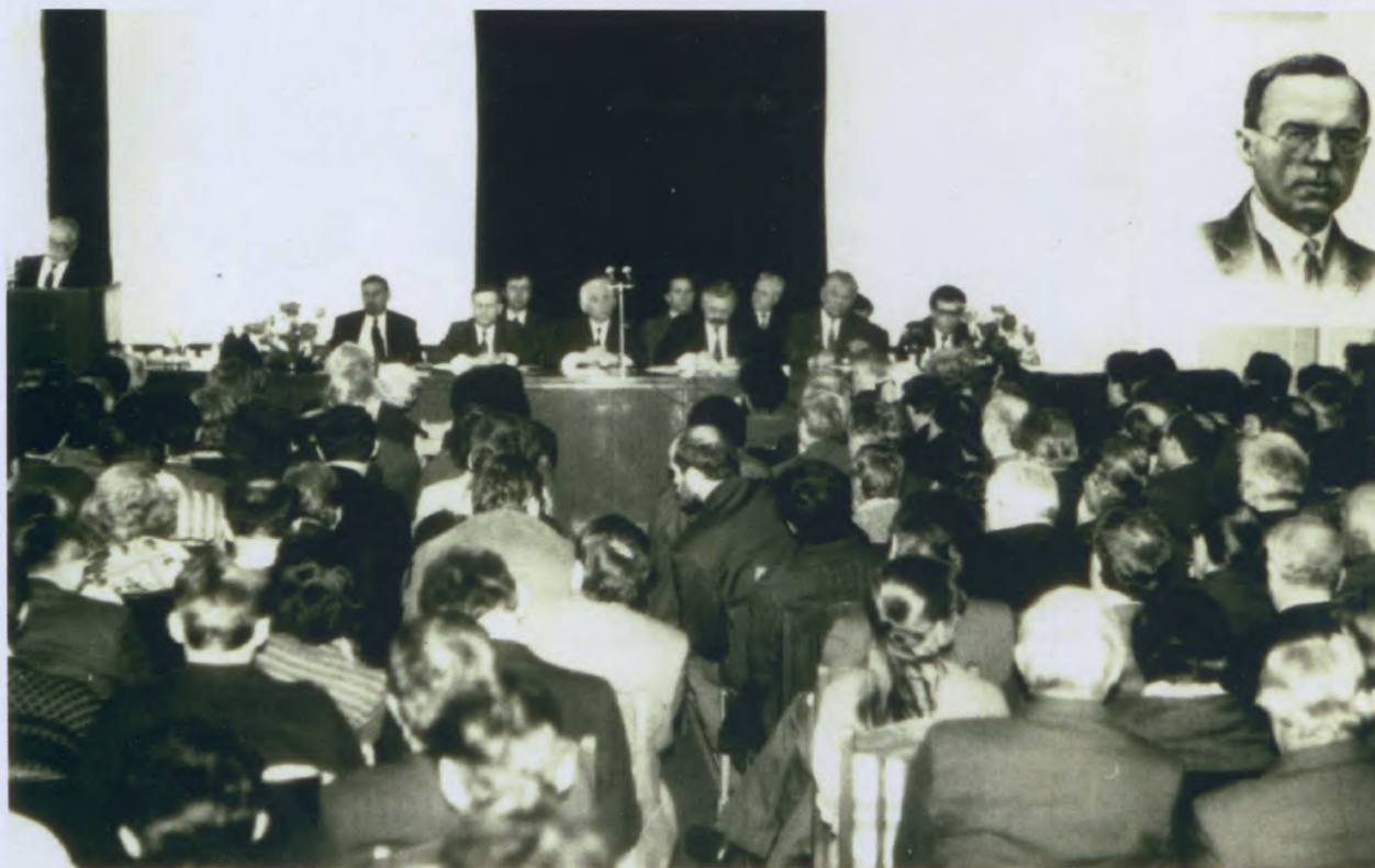
Конференция, посвященная 100-летию со дня рождения Н.Д. Кондратьева. Московская сельскохозяйственная академия имени К.А. Тимирязева, 10 корпус. 1992 г.