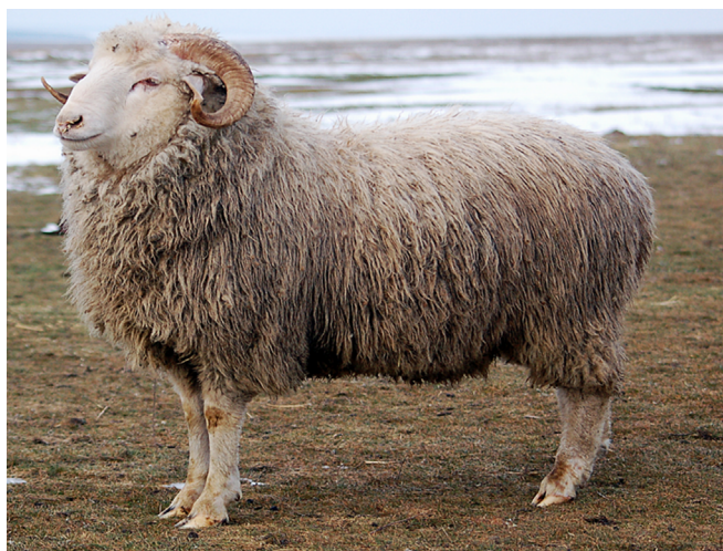
Рис. 2. Цигайский баранчик солнечного типа в возрасте 9 месяцев