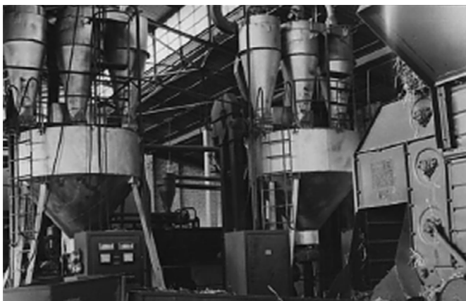
Рис. 8. Приготовление гранулированных кормосмесей Fig. 8. Preparation of granulated feed mixes

от каждой сотни обьягнвившихся маток. Средний настриг чистой шерсти с одной головы овцы составил 3,4 кг.