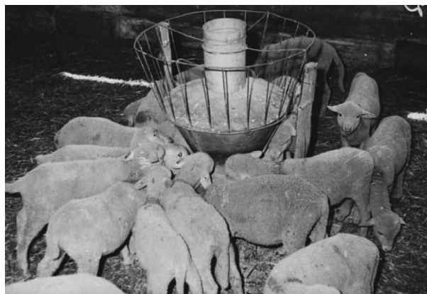
Рис. 4. Кормление молодняка Fig. 4. Feeding of young animals

Для сравнения в 2020 г. племенными хозяйствами Ставропольского края было получено 99% ягнят