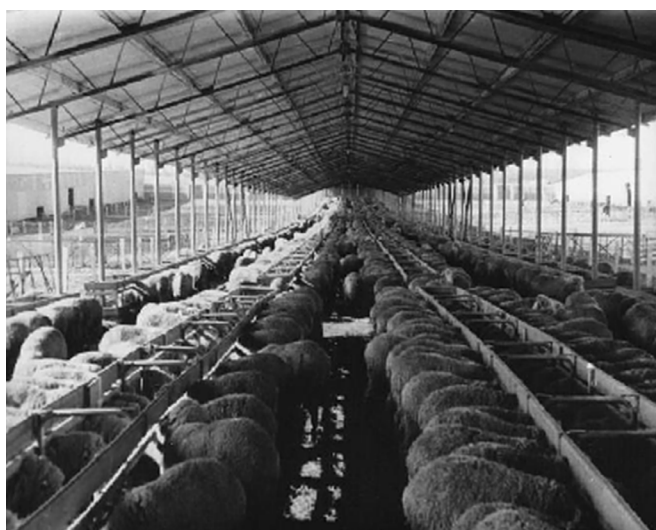
Рис. 6. Кормовые навесы Fig. 6. Aft canopies