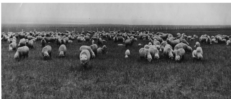
Рис. 2. Многолетнее пастбище

Переход на промышленную технологию требует жесткого исполнения всех регламентов технологических процессов. А значит, животные в отарах должны быть подобраны более тщательно по возрасту, развитию и продуктивности. Это невозможно без турового получения ягнят и уплотнения сроков ягнения, что возможно получить лишь при искусственном осеменении. Поэтому организация осеменения и ягнения маток в условиях овцеводческих комплексов имеет