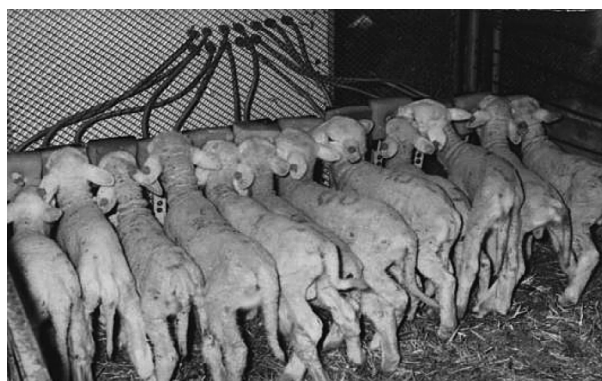
Рис. 5. Выпашивание молодняка Fig. 5. Grazing of young animals