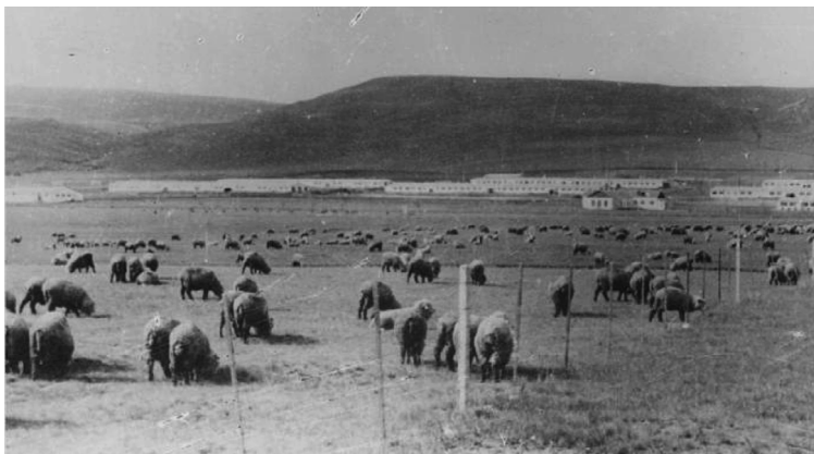
Рис. 3. Пастьба овец