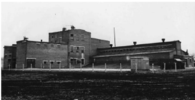
Рис. 7. Комбикормовый завод Fig. 7. Feed Mill