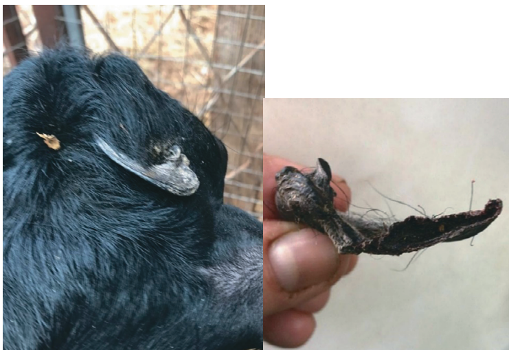
Рис. 3. Рост осколков роговой ткани после декорнуации

У 10% козлят, обезроженных методом коагуляции без удаления роговых зачатков, был зафиксирован рост осколков. Осколки представляли собой сильно ороговевшее образование, неправильной формы, напоминающее рог (рис. 3).