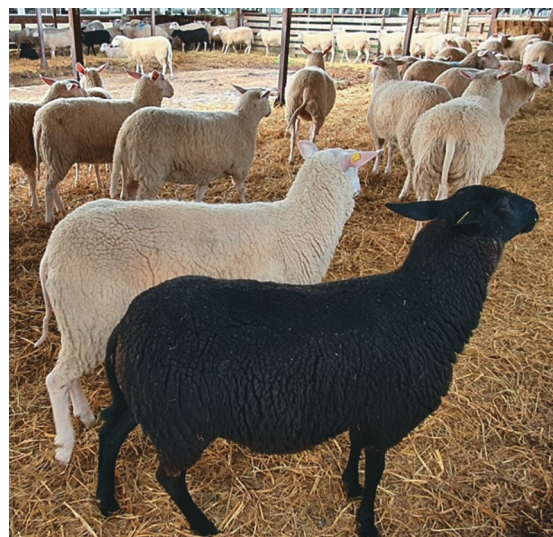
Рис. 1. Овцы помеси белой и черной масти Fig. 1. Sheep of a cross a white and a black suit

При малой изученности овечьего молока, по сравнению с коровьим молоком, нами было приобретено для анализа аномальное овечье молоко, имеющее низкую титруемую кислотность (12°Т) и щелочную среду по показателю активной кислотности – рН (7,24). При реакции с димасином такое молоко давало окраску, характерную для маститного молока. При нагревании молоко выдерживало кипячение и при воздействии самой высокой концентрации спирта по алкогольной пробе (80%-ной) не свертывалось.