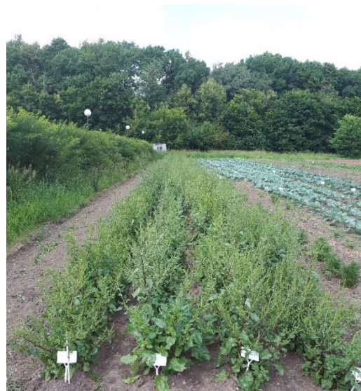
Рисунок 5.3. - Семенники столовой свеклы сорта Двусемянная ТСХА полученных из семян различных сроков хранения

У семян столовой свеклы сорта Двусемянная ТСХА урожая 2004 года энергия прорастания и всхожесть семян снизилась с 2014 года до 2022 на 60%. Для производства рекомендуемые сроки хранения семян 3-4 года, при этом биологическая долговечность семян столовой свеклы может составлять более 16 лет. Отличия полевой всхожести различных семей одного сорта в случае продолжительного хранения достигали 50%, соответственно можно вести селекцию по признаку сохранения всхожести семян. На полевую всхожесть семян решающее значение оказывают погодные условия в год выращивания семенников столовой свеклы.