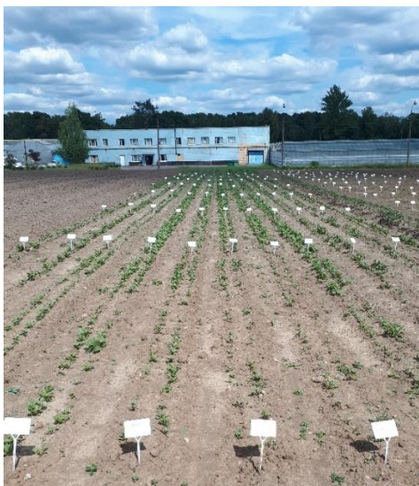
Рисунок 5.2. - Всходы семян столовой свеклы сорта Двусемянная ТСХА полученных из семян различных сроков хранения

Срок хранения семян сказывался на выровненности, урожайности, размере и форме корнеплодов столовой свеклы. В дальнейшей научной работе планируется более детально изучить вопросы хранения семян в зависимости от биотипов сортов и урожайность растений в зависимости от сроков хранения семян.