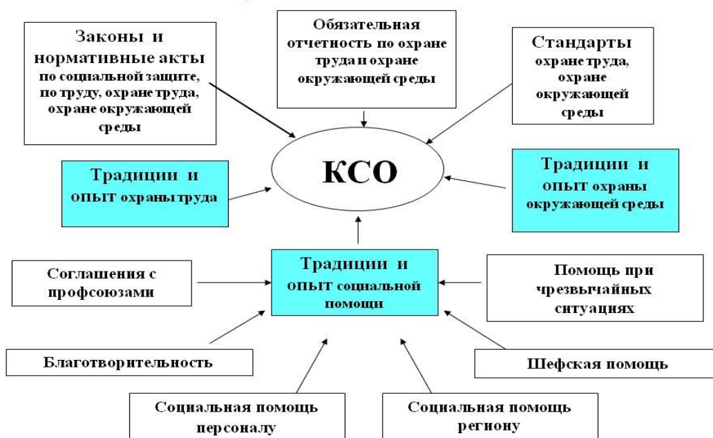
Рисунок 4 – Корпоративно-социальной ответственности в России

В мире основные драйверы ESG-трансформации компаний в агропромышленном комплексе связаны с тремя группами стейкхолдеров: потребителями, регуляторами и инвесторами.