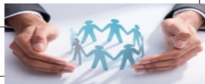
Рисунок 2 – Основные международные стандарты по социальному менеджменту

В июне 2021 года был опубликован первый в мире международный стандарт ISO 45003 «Управление охраной труда - Психологическое здоровье и безопасность на рабочем месте - Руководство по управлению психосоциальными рисками». Документ содержит рекомендации по управлению рисками, связанными с психологическим здоровьем и безопасностью в рамках системы управления охраной труда.