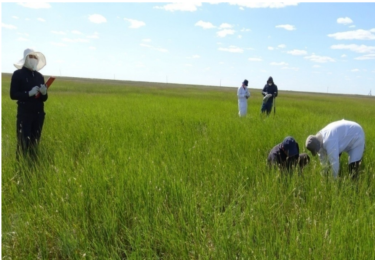
Рисунок 2–Состояние весеннего пастбища

хорошо поедаемых; 1 (очень плохая) – поедаются изредка; 0 – не поедаются.