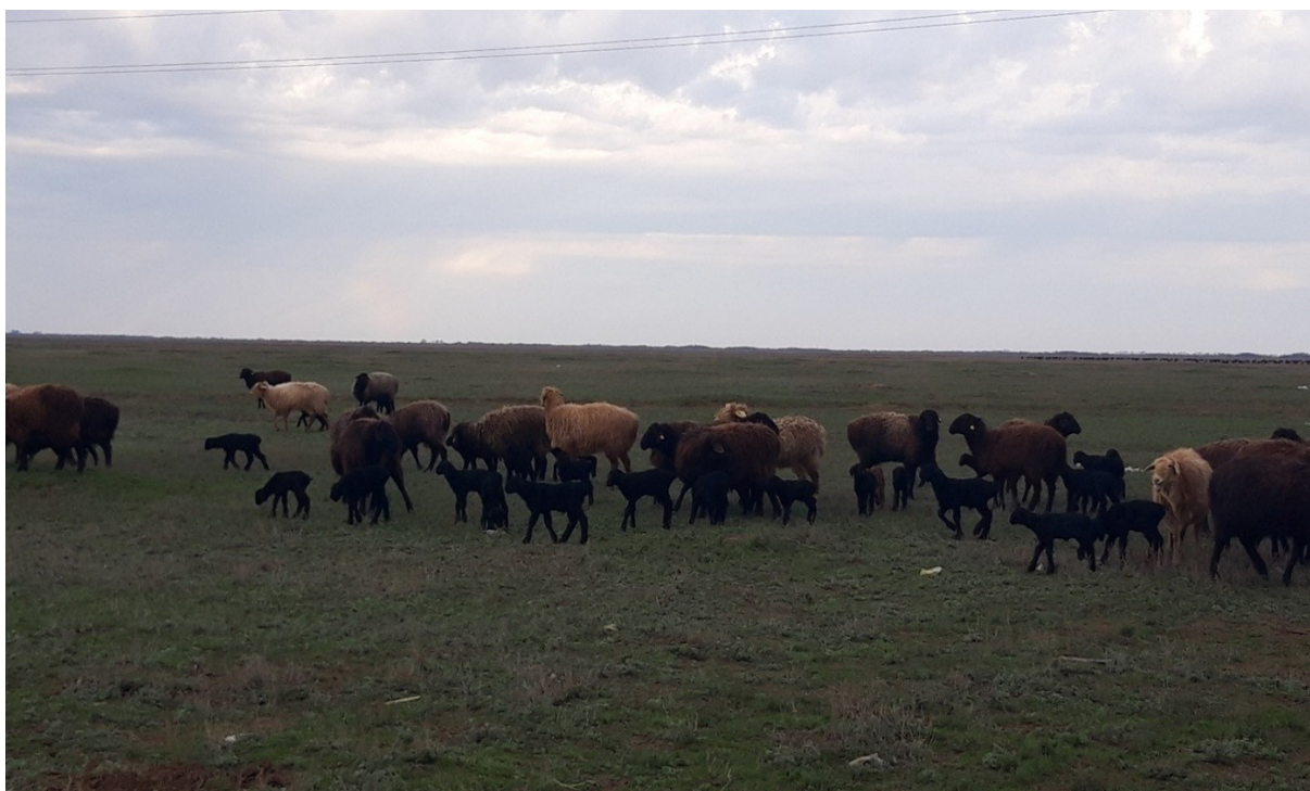
Рисунок 1– Овцематки курдючного направления на весеннем пастбище

Л.В. Матханова и др. (2010) при изучении нагульных качеств валушков тувинских короткожирнохвостых овец установила, что туши овец после нагула характеризовались достаточно хорошим отличием подкожного жира, имели округлый, раздвоенный хвост, масса жировых отложений на хвосте колебалась от 0,75 г до 1,2 кг.