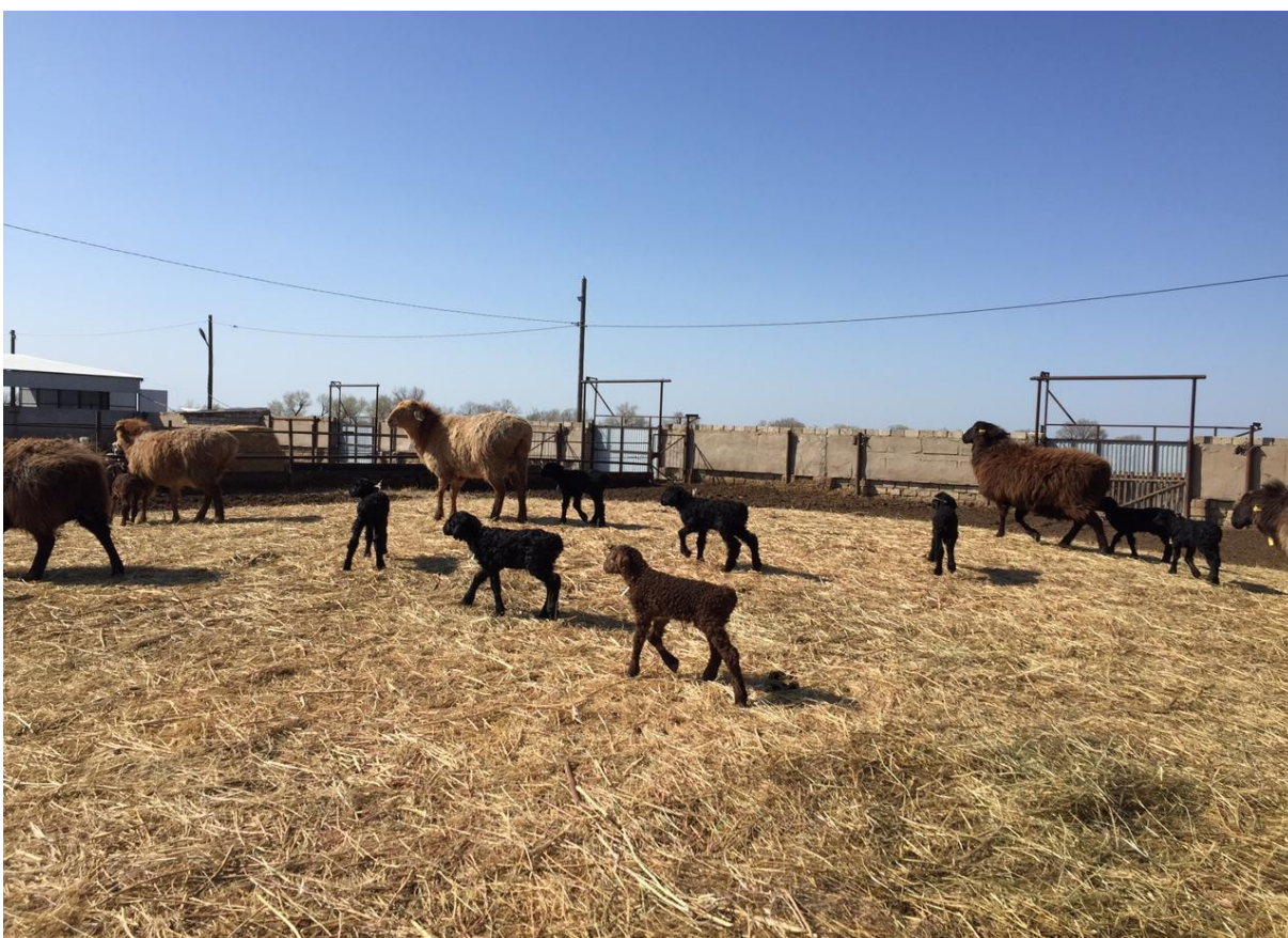
Фото 3– Овцематки эдильбаеской породы с ягнятами