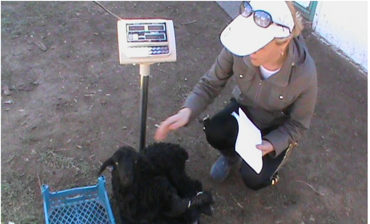
Фото 7, 8– Взвешивание и взятие промеров ягнят