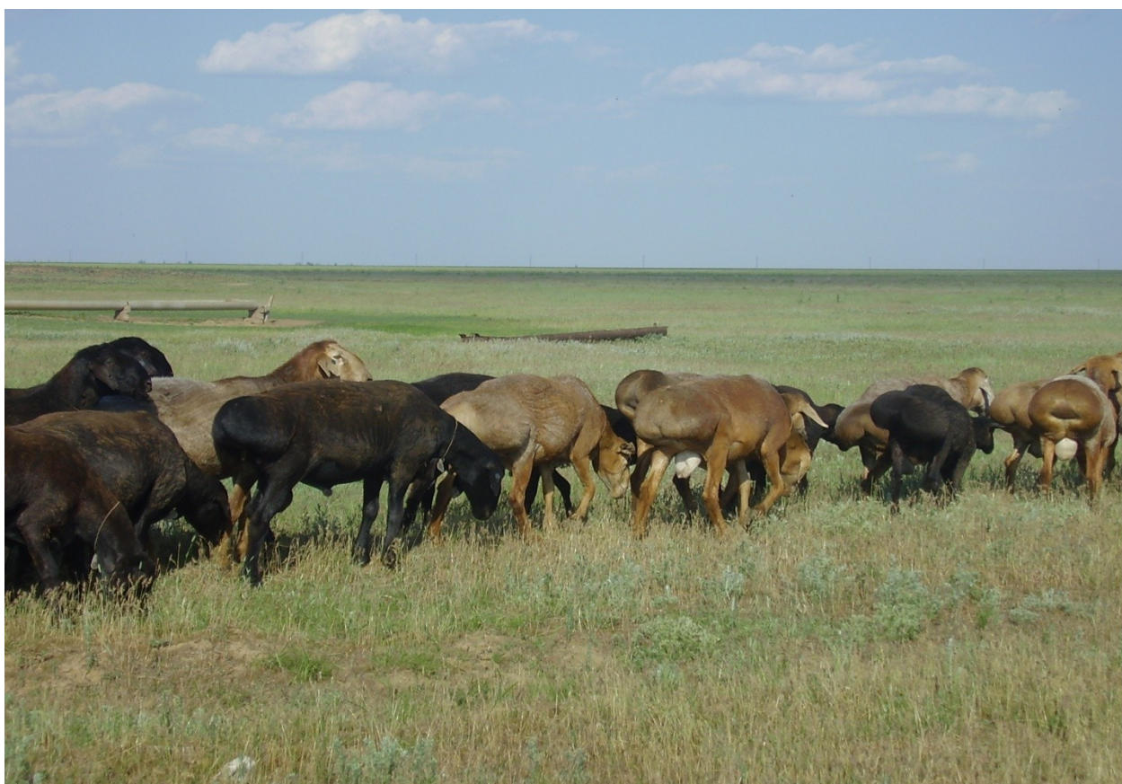
Фото 1– Группа баранов-производителей на пастбище