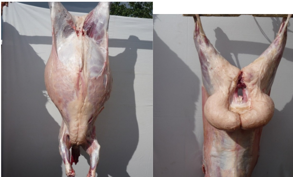
Фото 10, 11 – Туши 4,5 месячных ягнят эдильбаевской породы