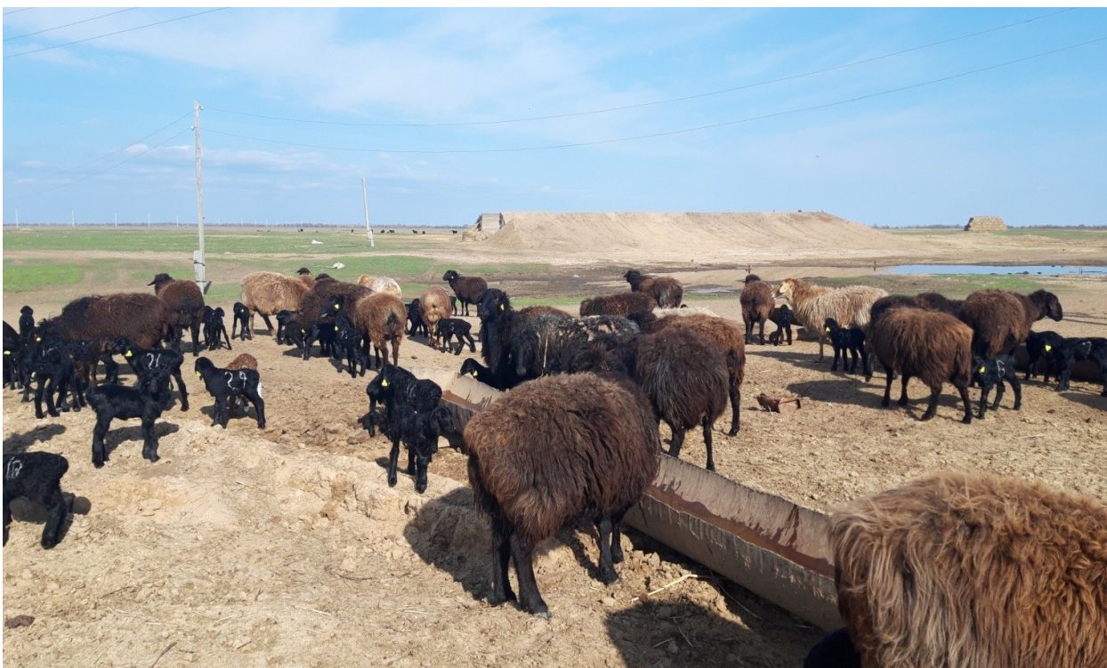
Фото 2 – Объягившиеся овцематки на водопое хояйства