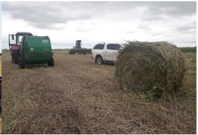
Рисунок 3 – Заготовка сена в КХ «Еділбай»