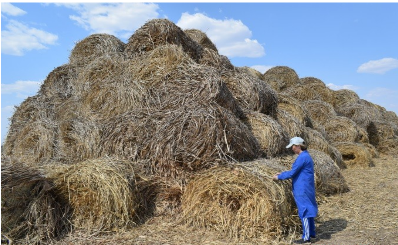
Фото 5, 6 – Проведение зоотехнических мероприятий