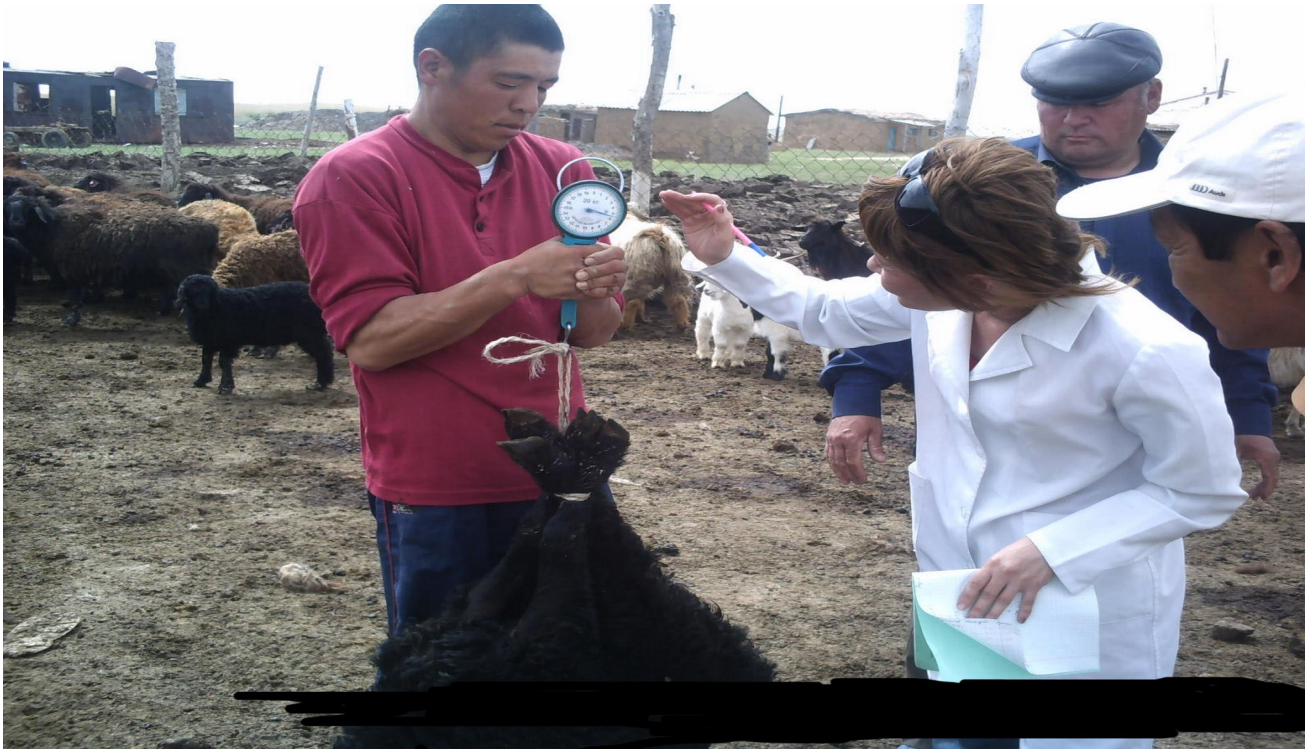
Фото 8, 9– Взвешивание промеров у овец разных половозрастных групп