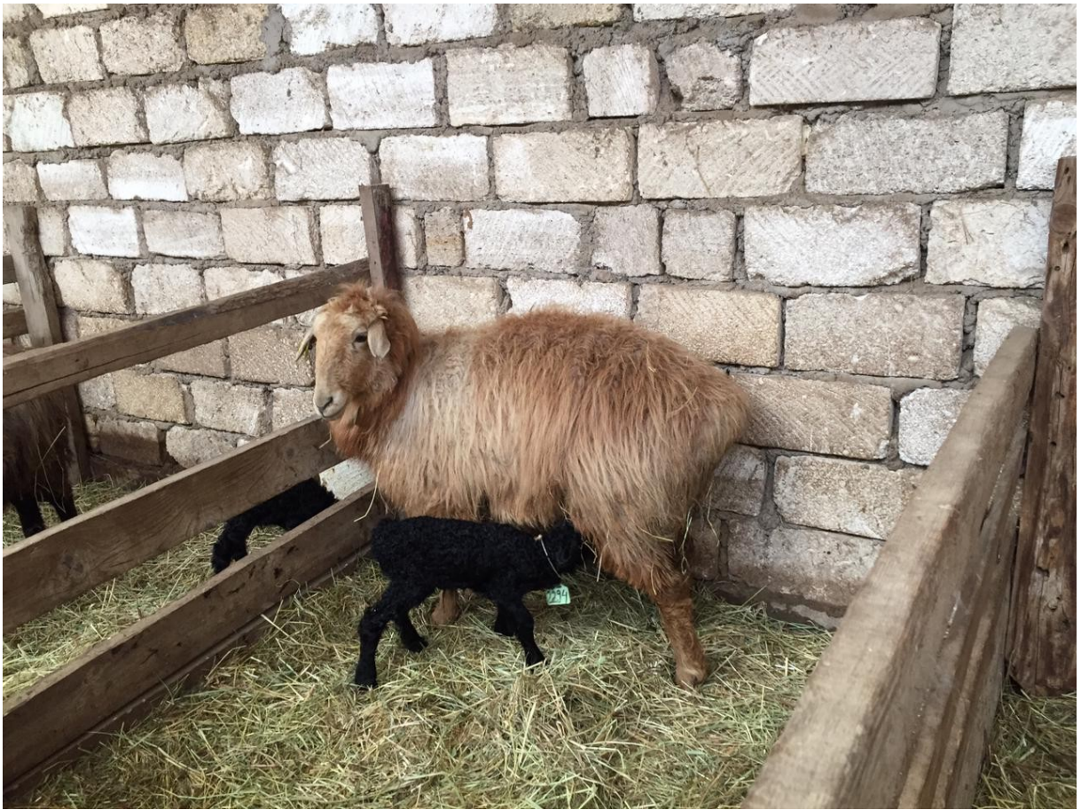
Фото 4– Овцематка с ягненком