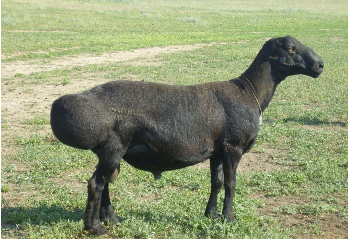
Рисунок 6 – Баран–производитель эдильбаевской породы брликского внутрипородного типа, инд. №, KZL31869811

Отличительной особенностью брликских овец является то, что они имеют глубокую грудь с сильно развитой грудной костью, несколько удлинненным туловищем, развитый костяк, а также характеризуются интенсивностью роста молодняка в молочный период (298-306 г).