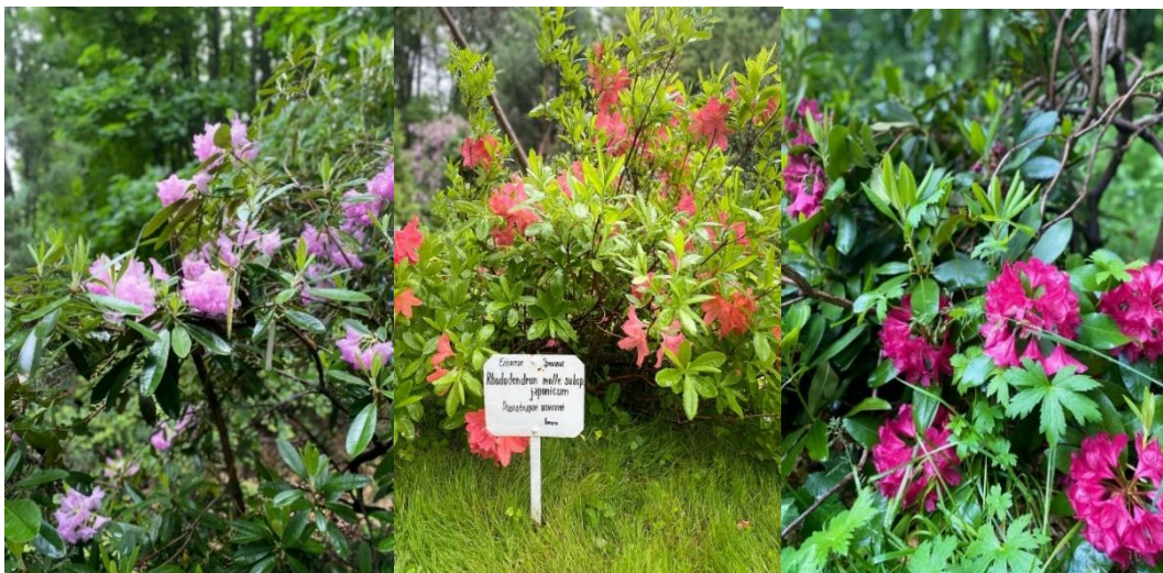
Рис. 1 R. Catawbiense 'Lunik', Rhododendron molle subsp. Japonicum , R. Catawbiense 'Nova Zembla' (слева-направо). Дата: 03.06.2023 г.

На сегодняшний день работниками дендросада проводится работа по поддержанию и обновлению коллекции. Особое внимание уделяется методам размножения культуры. Традиционно для размножения большинства видов рододендрона используют стеблевые черенки. Однако метод клонального микроразмножения приобретает всё большее значение в коммерческом производстве для получения большого количества посадочного материала новых и высокодекоративных видов и сортов. Усилия по созданию эффективных протоколов продолжаются уже несколько десятилетий [4].