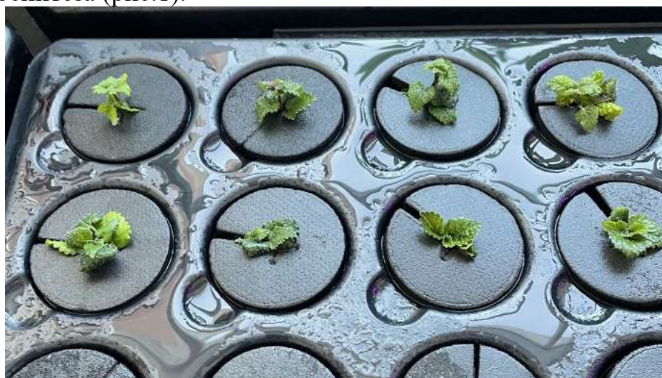
Рисунок 1 - Мелисса лекарственная, пересаженная на аэропонику

Объектом исследования служили микроклоны Mentha piperita L. и Melissa officinalis L. Образцы первоначально были размножены на безгормональной питательной среде, содержащей минеральные соли по прописи Мурасиге и Скуга (MS). Микроклоны выращивали в пробирках в условиях световой комнаты, где поддерживался 16-часовой фотопериод, температура 22 \pm 10^\circ\text{C} и освещение белыми люминесцентными лампами с интенсивностью 3 тыс. лк. В аэропонной установке - пропатор X-Stream 120 (производство Нидерланды), состоящий из жесткой пластмассы, заливали 40 л дистиллированной воды, а затем добавляли \frac{1}{2} от объема раствор MS. Для сравнения роста и развития мяты перечной использовали два варианта: 1) с добавлением гормона – ауксина ИУК концентрацией 0,5 мг/л для усиления роста корней; 2) с добавлением гормона – ИМК концентрацией 0,5 мг/л. Для мяты лекарственной использовали только один вариант – с добавлением гормона ИУК концентрацией 0,5 мг/л. Перед пересадкой в условия аэропонной системы образцы делили на две группы: первая группа состояла из растений с корневой системой; вторая группа – без корня. Обязательно было наличие одной-двух пар листьев для протекания процесса фотосинтеза (рис.1).