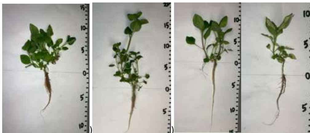
Рисунок 3- Растения мяты перечной по истечении 3 недель: а), б) - микроклоны изначально без корней; в), г) – микроклоны с корнями

Микроклоны мелиссы лекарственной выращивали на одной питательной среде с добавлением ИУК концентрацией 0,5 мг/л. Самым эффективным оказался метод, когда перед пересадкой у микроклонов удаляли корневую систему. Индекс роста побегов и корней у не укорененных равен 1,09 и 7,31 соответственно, в то время как у укоренных – 0,78 и 6,69 (таблица 1).