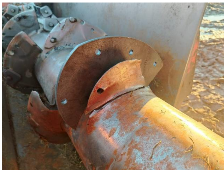
Рисунок 2 – Изношенный виток шнека в сравнении с новым

Принцип модульной замены изнашиваемых частей шнека заключается в замене витков шнека без снятия самого шнека с машины, что в свою очередь помогает экономить время и средства при ремонте смесителей-кормораздатчиков. Процесс делится на 5 этапов: