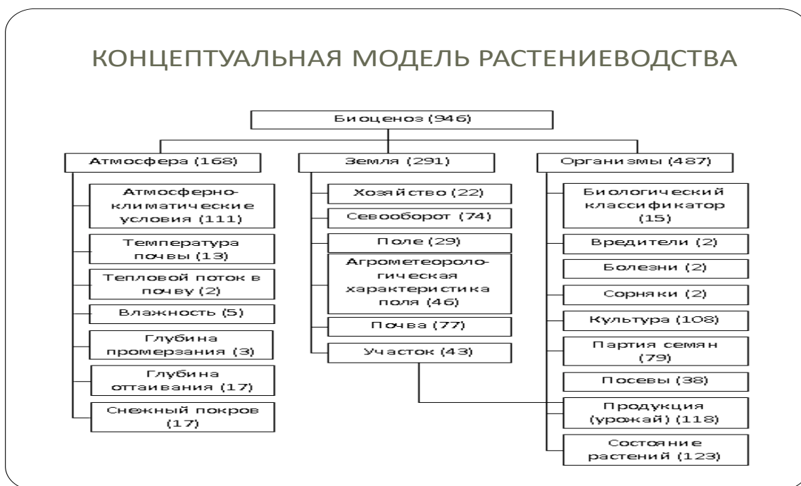
Рисунок 2. Агрегированная концептуальная информационная модель растениеводства

логистики в ЦПУ АПК. И, наконец, ЦПУ позволит эффективно осуществить автоматизацию процессов планирования и мониторинга исполнения планов участников производства и реализации продукции АПК на базе рассмотренных выше цифровых стандартов и архитектурных решений.