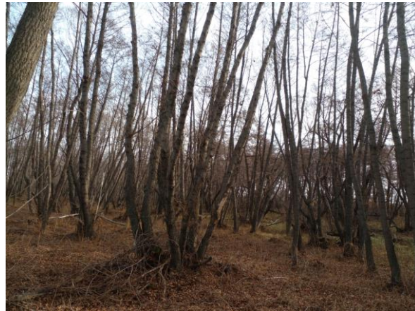
Рисунок 1 - Насаждение ольхи черной на исследуемом участке

лесные сообщества легко подвергаются негативному воздействию и очень тяжело восстанавливаются. В условиях аридного климата Оренбургской области и господства степей, повышенная влагообеспеченность приречьевых экосистем определяет развитие в их пределах различных вариантов луговой и лесной растительности.