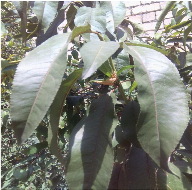
Рисунок 1. Здоровые листья персика