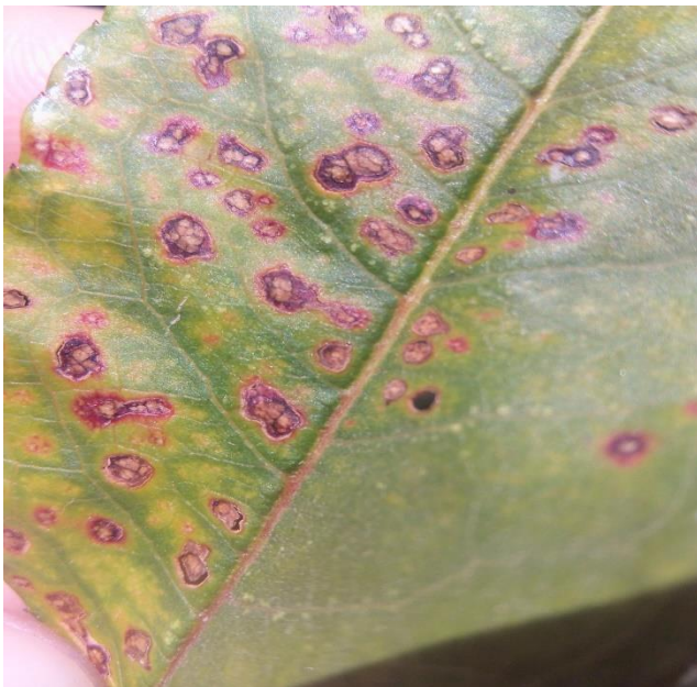
Рисунок 3. Расширяющиеся пятна