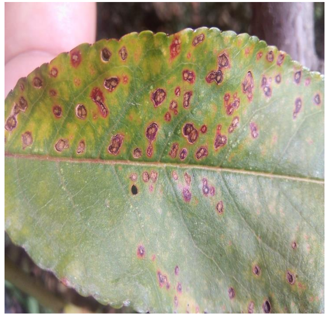
Рисунок 2. Больные листья персика