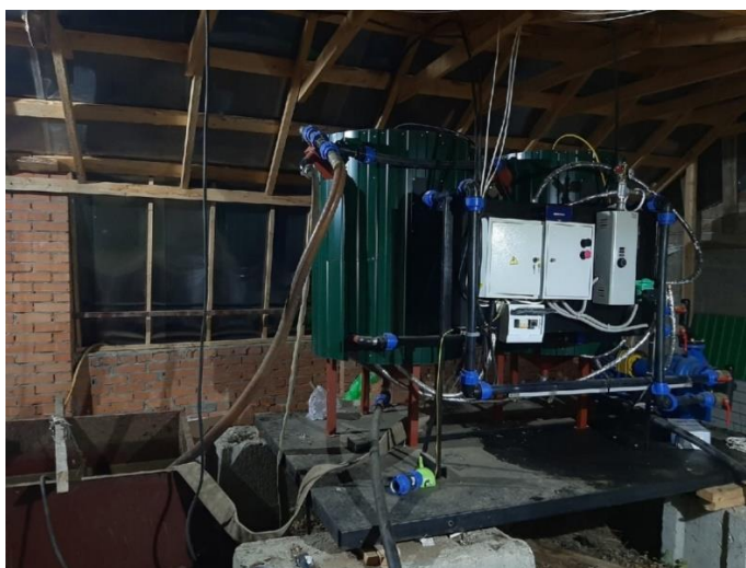
Рисунок - 1. Экспериментальный образец биогазовой установки.

Исследование влияния температурного режима и периодичности перемешивания на процесс анаэробного сбраживания, которые представлены в данной работе, проводились на экспериментальном образце биогазовой установки (рисунок 1). Были выбраны пределы: для температуры 25 0 С - 50 0 С, периодичность перемешивания 2 - 6 раз, а в качестве выходной переменной «у» – выход биогаза м 3 .