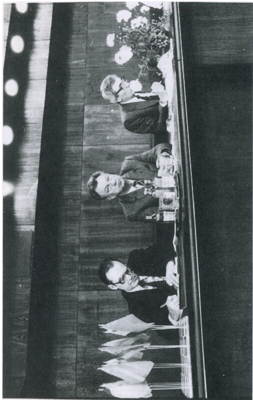
Эстония, г. Тарту, 1986 г.