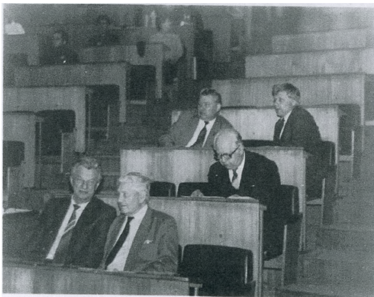
На заседании Ученого совета зооинженерного факультета, 1991 г.