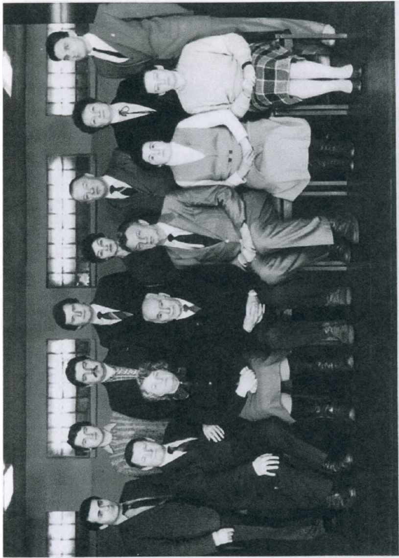
Коллектив кафедры молочного и мясного скотоводства в 80-е годы