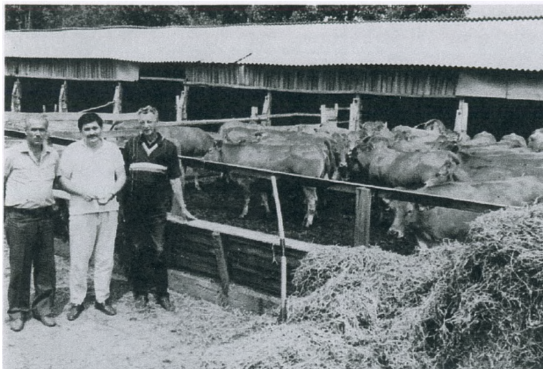
На ферме крупного рогатого скота в Венгрии, 1989 г.