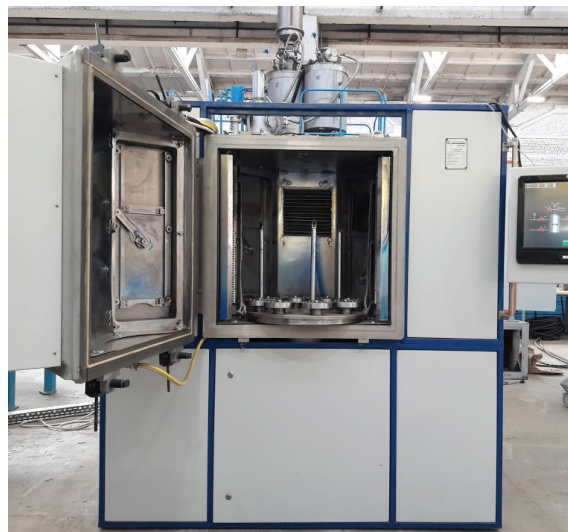
Рис. 4. Внешний вид установки УНП-300

и описано в работах ряда авторов [8-10], что делает возможным изучение материала и создание оборудования в условиях промышленного производства.