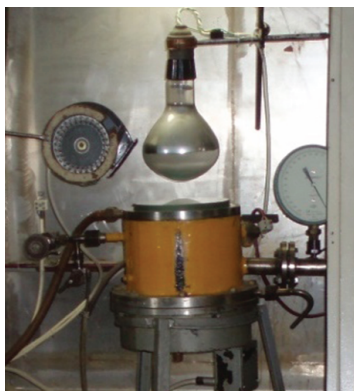
Рис. 3. Внешний вид реакционной камеры с инфракрасным нагревателем