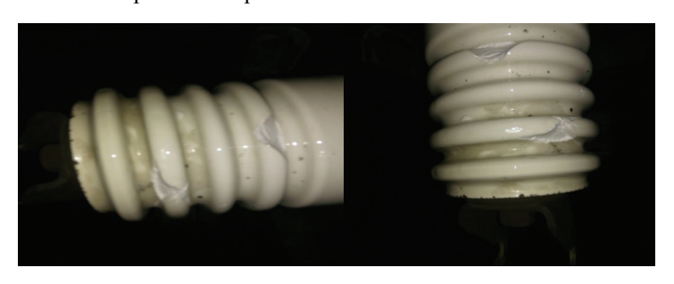
Рис. 3. Сколы на теле фарфорового изолятора

струировании и монтаже современных шинных мостов применяют полимерные изоляторы. Предлагается переоснащение эксплуатирующихся шинных мостов 10 кВ полимерными изоляторами, что позволит повысить надежность их работы путем исключения наиболее частой причиной их отказа.