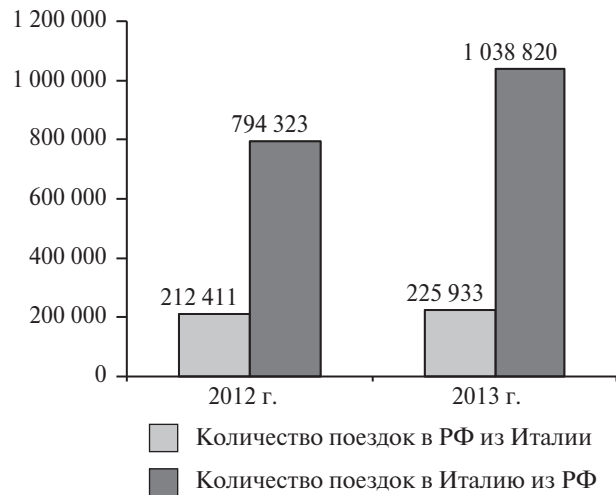
Рис. 1. Структура поездок в РФ и Италию

По последним статистическим данным Федерального агентства по туризму Министерства культуры Российской Федерации (Ростуризм), по итогам 2013 года выезд в Италию россиян увеличился на 30,78 % по сравнению с предшествующим годом и составил более 1 млн поездок (7-е место по выезду граждан РФ), тогда как въезд граждан Италии в Россию в 2013 году вырос на 6,37 % и составил 226 тыс. поездок (8-е место по въезду граждан ЕС) (рис. 1).