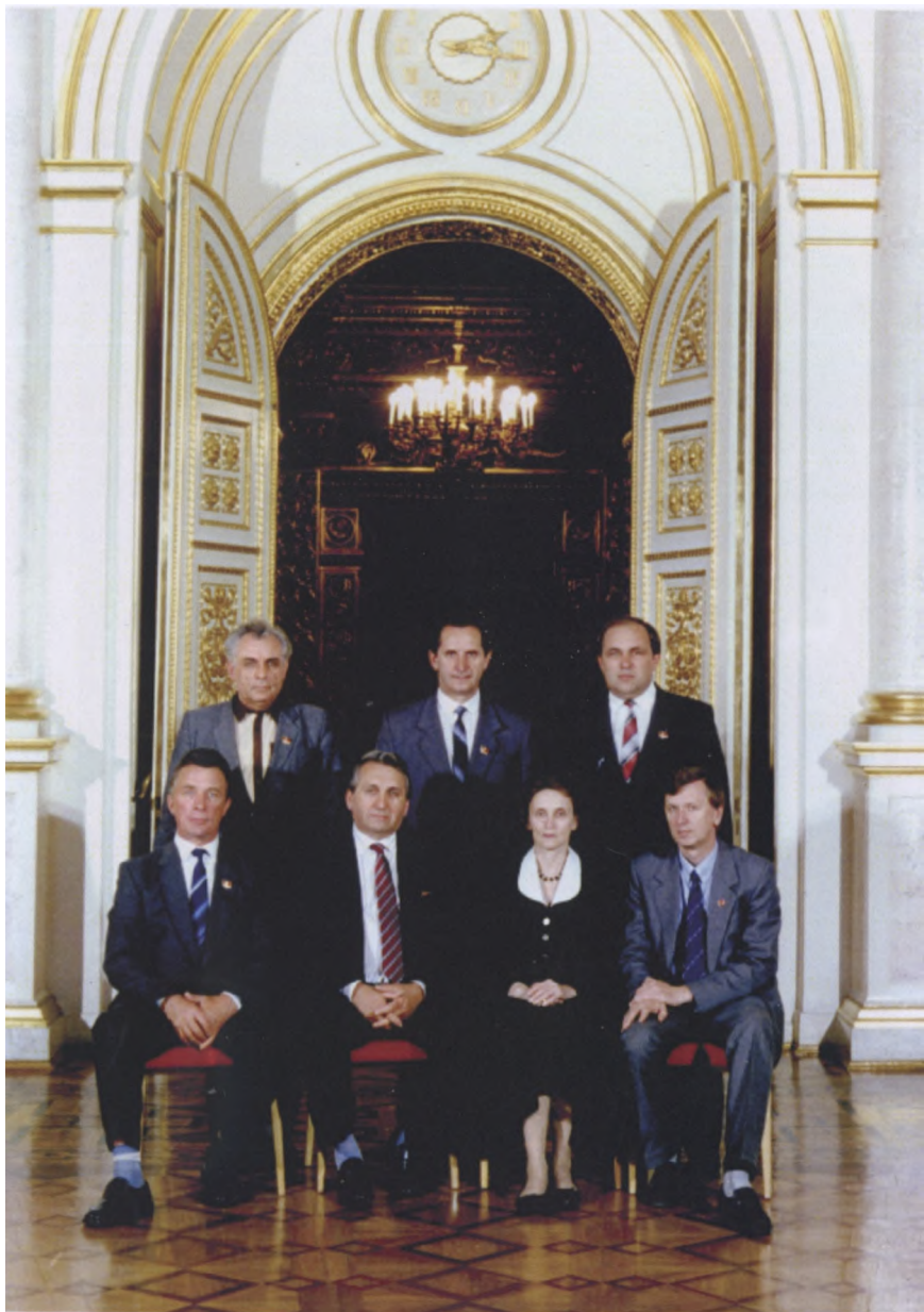
Делегат XXVIII съезда КПСС (1990 г.)