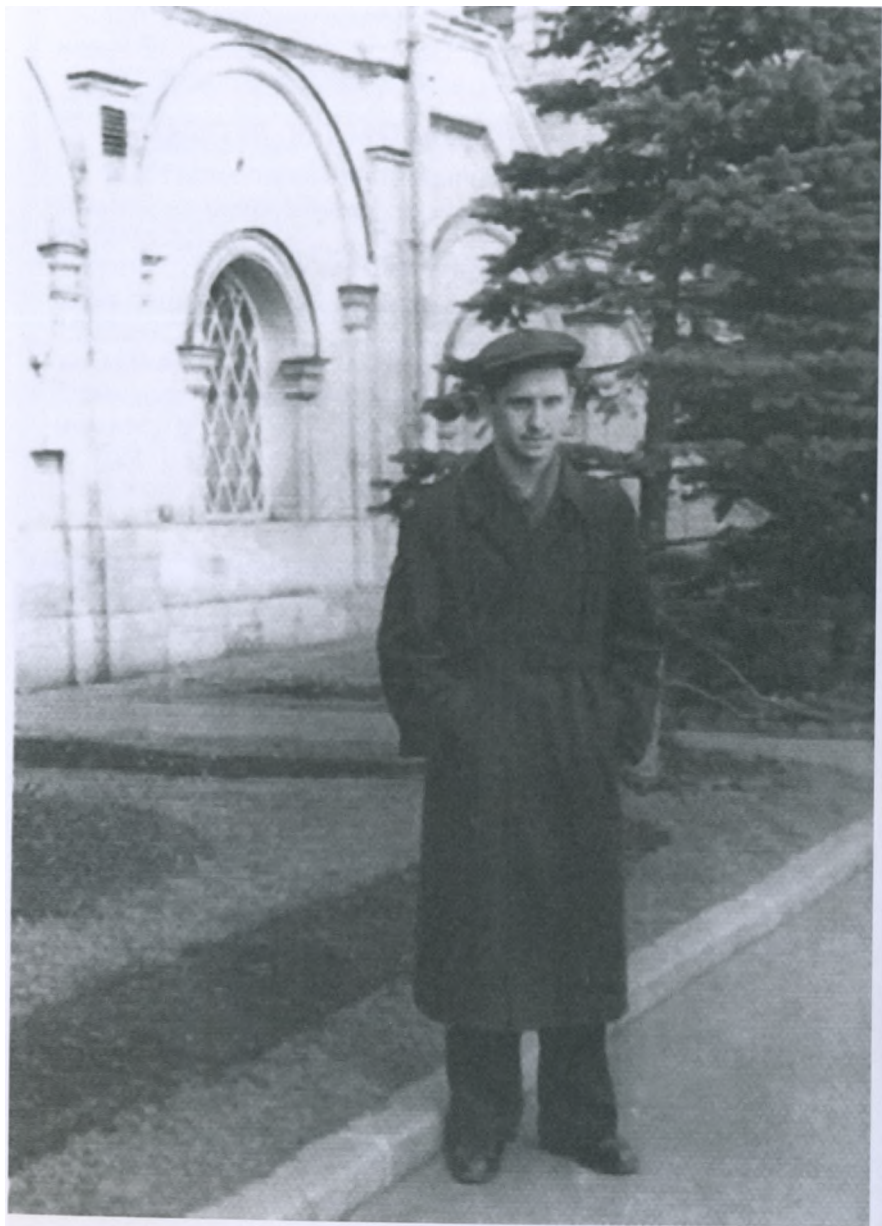
Студент 1-го курса Тимирязевской академии (1954 г.)