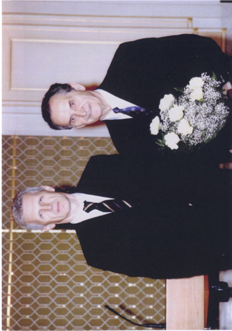
Вручение диплома лауреата премии Правительства РФ в области образования за создание учебника «Курс социально-экономической статистики» (2006 г.)