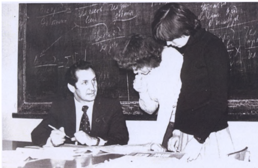
Лабораторно-практические занятия со студентами