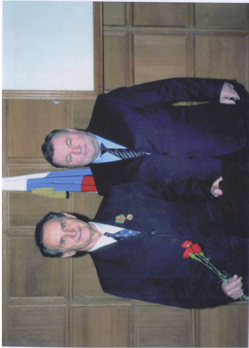
Вручение золотой медали МСХ РФ «За вклад в развитие агропромышленного комплекса России» (2007 г.)