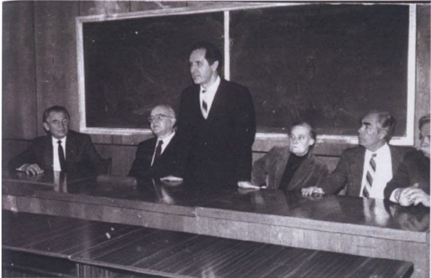
Декан экономического факультета ТСХА (1992 г.)