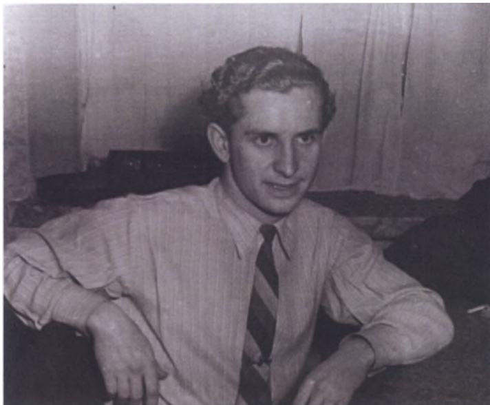
Аспирант экономического факультета ТСХА (1960 г.)