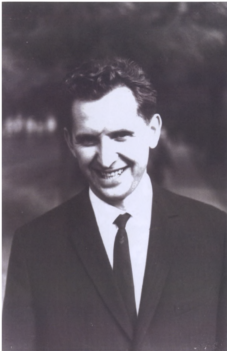
Доцент кафедры статистики, заместитель декана экономического факультета