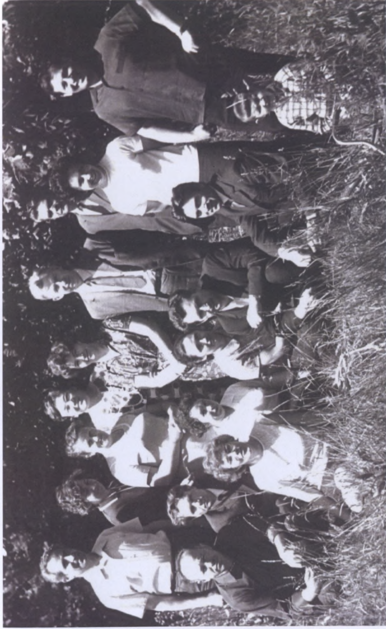
Поездка со слушателjami факультета повышения квалификации в с. Абрамцево