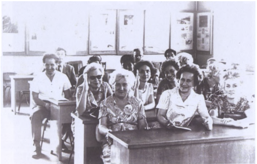
Со слушателями факультета повышения квалификации на кафедре статистики