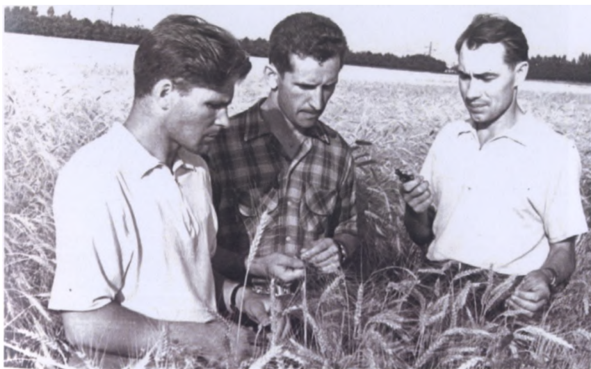
Работа на опорном пункте ВНИИЭСХ в совхозе «Гигант» Сальского района Ростовской области (1959 г.)