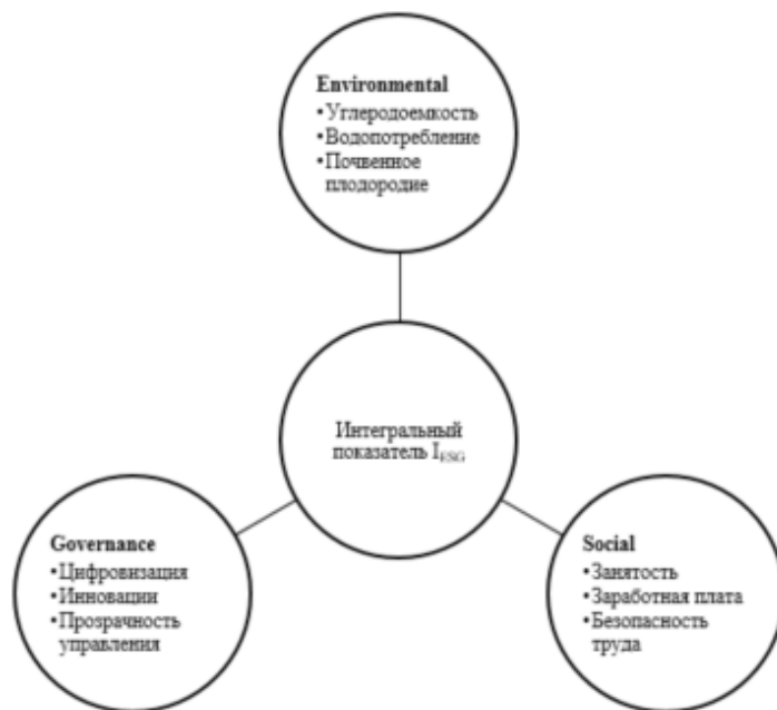
Рис. 1. Концептуальная модель системы показателей сбалансированного развития зернопродуктового подкомплекса (разработано авторами)

Исследования вносят вклад в развитие региональной экономики через обоснование специфических факторов устойчивого развития территориальных агропромышленных систем. Предложенная система показателей учитывает не только экономические, но и экологические, и социальные аспекты развития, что соответствует современным трендам перехода к модели устойчивого развития.