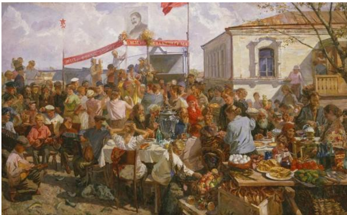
А.А. Пластов «Колхозный праздник» (1937)

Коллективные хозяйства выплачивали заработанное трудом в натуральной форме – зерном, овощами и так далее. Размер вознаграждения зависел от отработанных часов и качественных показателей труда. Такой механизм оплаты труда назывался системой «трудодней». Часто заработок был настолько низким, что колхозники едва могли прокормить свои семьи, вынуждая искать дополнительные способы заработка.