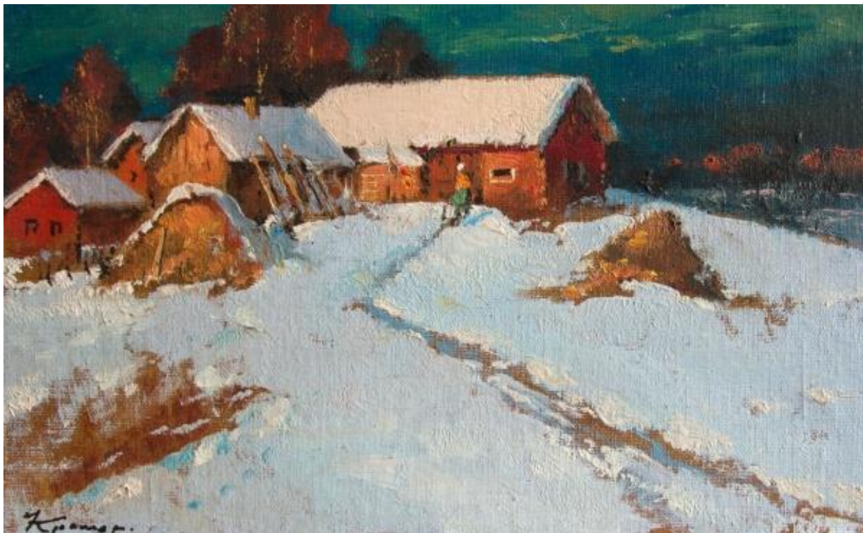
М. Кремер. «Март в деревне» (1988)

кооперации», который разрешал создание кооперативов в различных сферах, включая сельское хозяйство. Это позволило организовать более свободные формы хозяйствования, но не изменило ситуацию кардинально. Первые фермеры и сельхозкооперативы на практике сталкивались с огромным количеством нерешенных проблем: отсутствием прав на землю, зависимостью от системы материально-технического снабжения и диктатом местных властей.