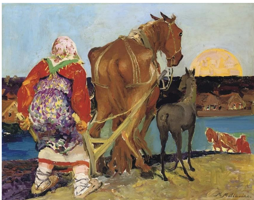
Ф.А. Малявин. «Вспашка на закате» (начало XX в.)

Кризис «третьеиюньской монархии». На рубеже 1916–1917 гг. в Российской империи сформировался системный кризис государственной модели «третьеиюньской монархии», усугубленный затяжным участием страны в Первой мировой войне. Военные действия спровоцировали комплекс взаимосвязанных экономических проблем: продовольственный, топливный и транспортный кризис. Наиболее серьезным оказался именно транспортный кризис, поскольку именно от состояния транспорта зависели логистика поставок продовольствия и топлива по стране, обеспечение фронта необходимыми ресурсами и поддержание связи между фронтовыми частями и тылом. Железнодорожная инфраструктура работала в крайне напряженных условиях: масштабная мобилизация привела к дефициту рабочих рук, а постоянно увеличивающиеся объемы военных перевозок значительно перегружали дороги. Три кризиса – продовольственный, транспортный и топливный – накладывались друг на друга, создавая непомерную нагрузку на железнодорожную систему, что вызвало серьезные сбои в перевозках грузов, стремительный рост цен и резкое ухудшение ситуации с распределением жизненно важных ресурсов по всей стране. Сложившаяся обстановка стала одной из ключевых предпосылок революционных событий 1917 г.