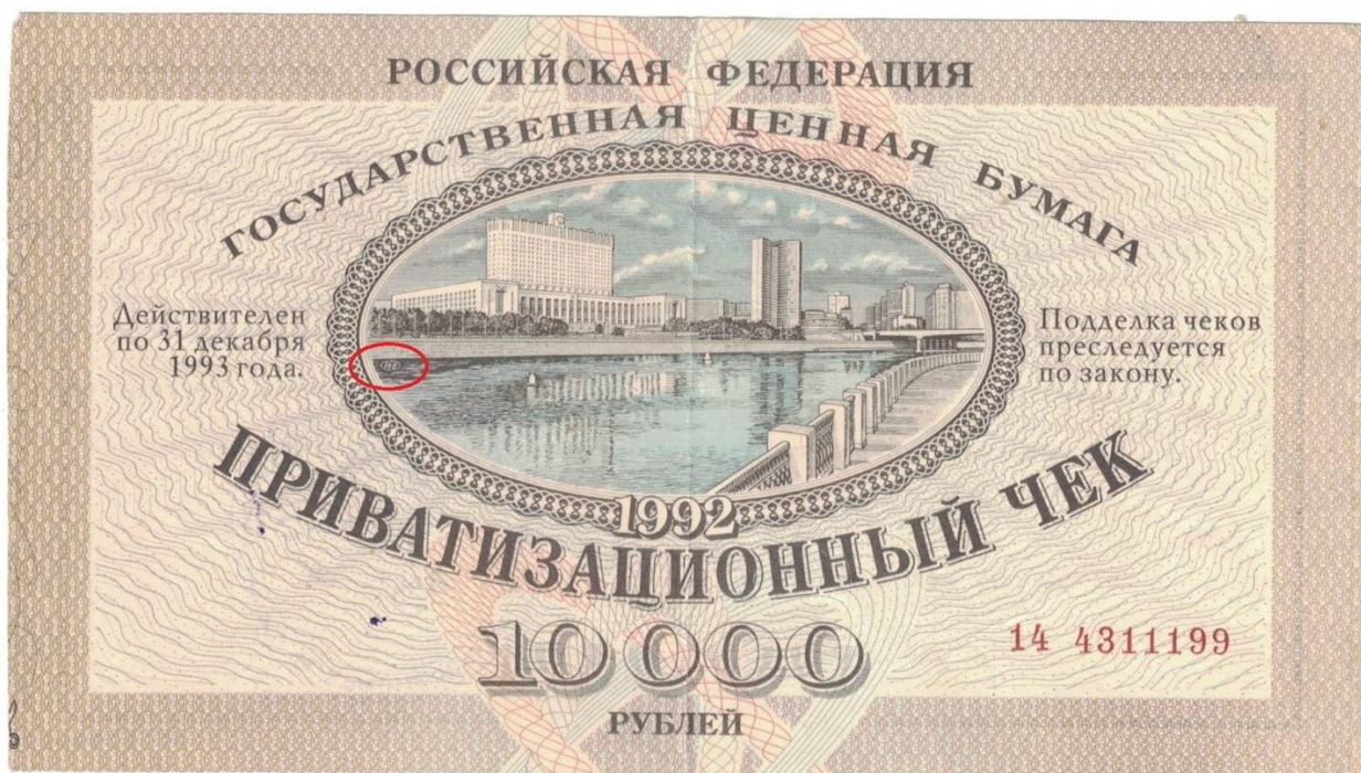
Приватизационный чек (ваучер)

продажа на вторичном рынке. Вследствие низкой финансовой грамотности большинства населения доминирующей стратегией стала продажа ваучеров, что спровоцировало их массовую скупку по заниженной стоимости коммерческими банками и иными структурами. Дополнительным негативным фактором стало распространение псевдо-инвестиционных фондов, функционировавших по принципу финансовых пирамид. В результате данных процессов основная масса государственной собственности сконцентрировалась в руках ограниченной группы лиц, сформировавшей класс крупных частных собственников (олигархов).