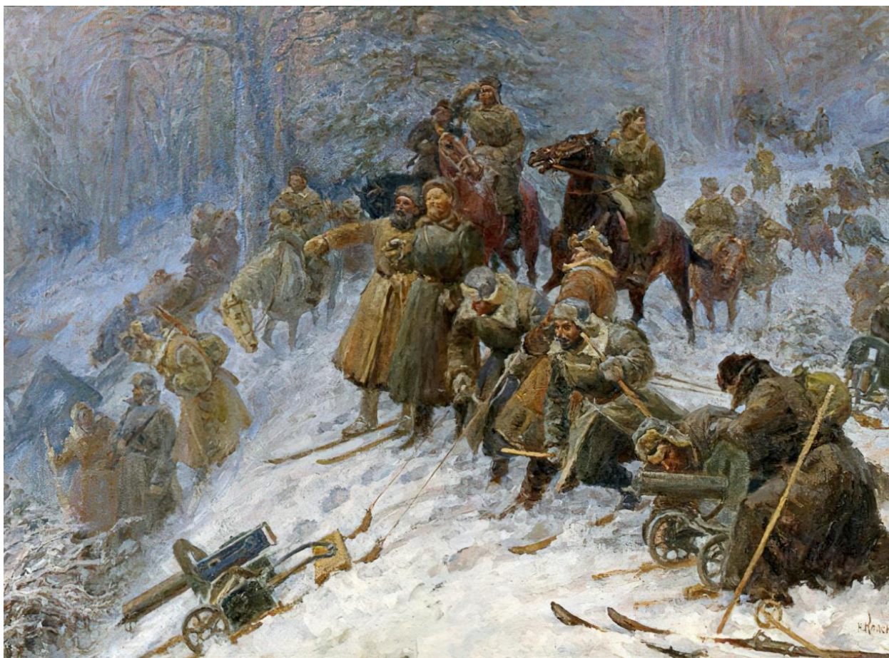
Н.К. Краснов. «Партизанский край» (1940-е)

организованную силу. При Ставке Верховного Главнокомандования был создан Центральный штаб партизанского движения, координировавший действия на оккупированной территории.