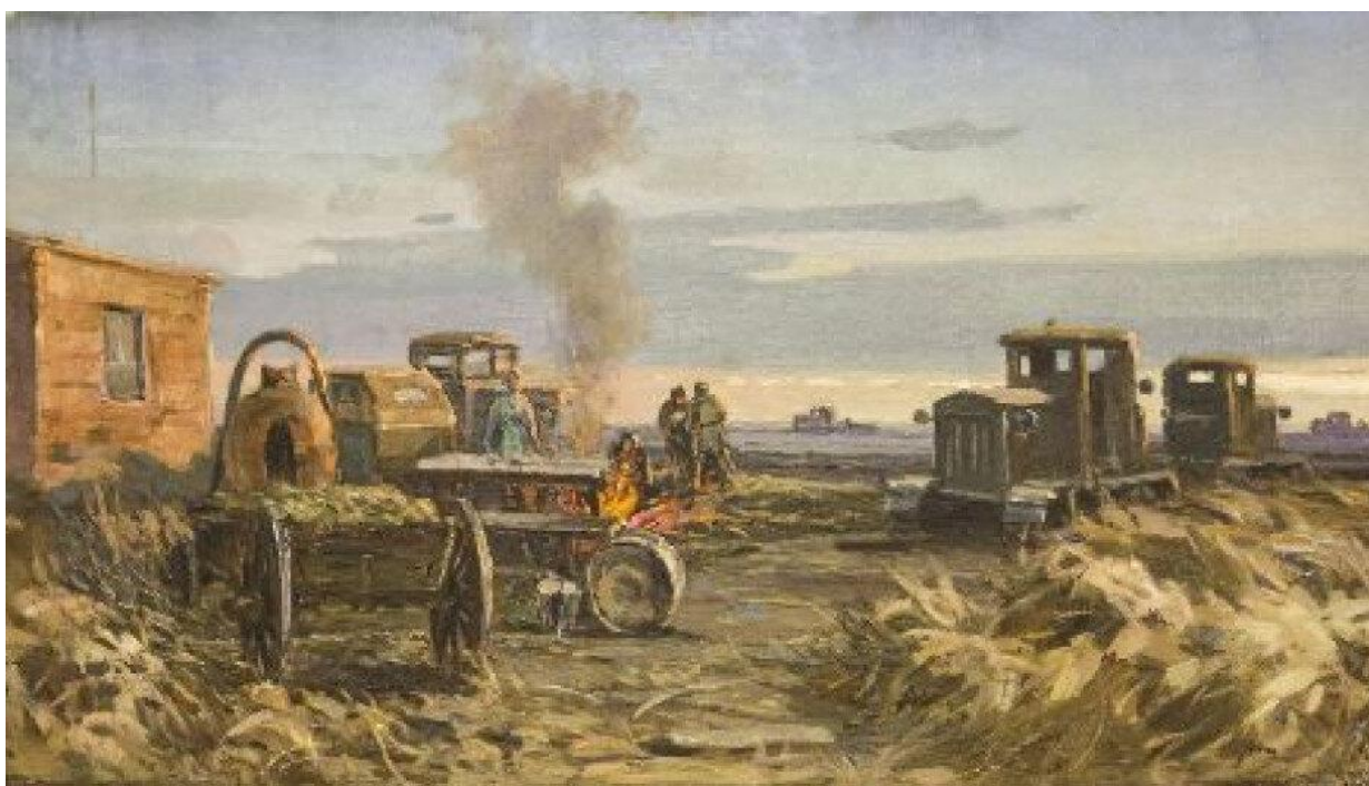
Ф.А. Филонов. «Вечер на целине» (1950-е)

Период характеризовался комплексом мер по интенсификации аграрного производства: увеличение государственных закупочных цен на сельхозпродукцию; снижение налогового бремени с личных подсобных хозяйств; ускоренная механизация - поставки новой техники в колхозы.