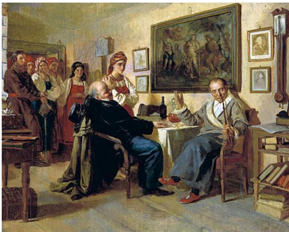
Н.В. Неврев. «Торг. Сцена из крепостного быта. Сцена из недавнего прошлого» (1866)

неспособность крепостной экономики обеспечить достаточные темпы роста для конкуренции с индустриальными странами Европы.