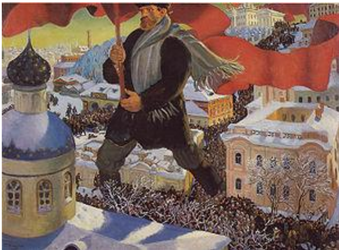
Б.М. Кустодиев. «Большевик» (1920)

Ограниченность результатов крестьянского движения была обусловлена недостаточной организованностью и локальным характером выступлений. Осознавая необходимость преобразований, правительство в послереволюционный период предприняло попытку модернизации аграрных отношений через столыпинские реформы, направленные на развитие