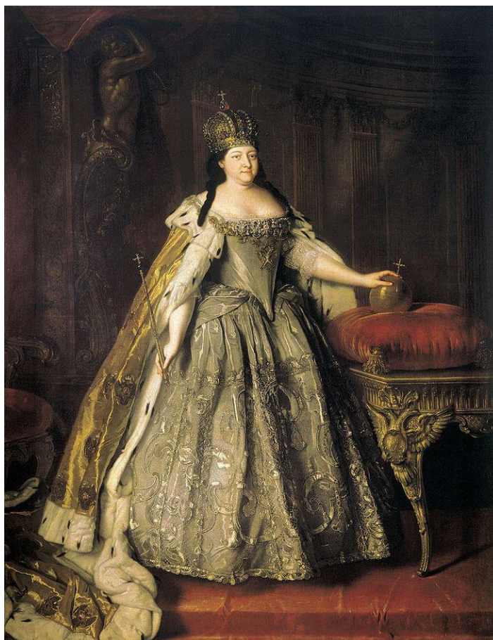
Л. Каравак. Портрет императрицы Анны Иоанновны (1730)

Трансформация системы государственного управления. В сфере высшего государственного управления произошли существенные изменения. В 1731 г. был учрежден Кабинет министров из трех лиц, постепенно сосредоточивший в своих руках основные административные и финансовые функции. К 1735 г. подписи кабинет-министров получили силу императорского указа, что формально делало их коллегиальные решения равными повелениям монарха. Параллельно был восстановлен Сенат, хотя его роль постепенно уменьшалась в пользу Кабинета. Для обеспечения политической безопасности создана Канцелярия тайных и розыскных дел, занимавшаяся расследованием государственных преступлений.