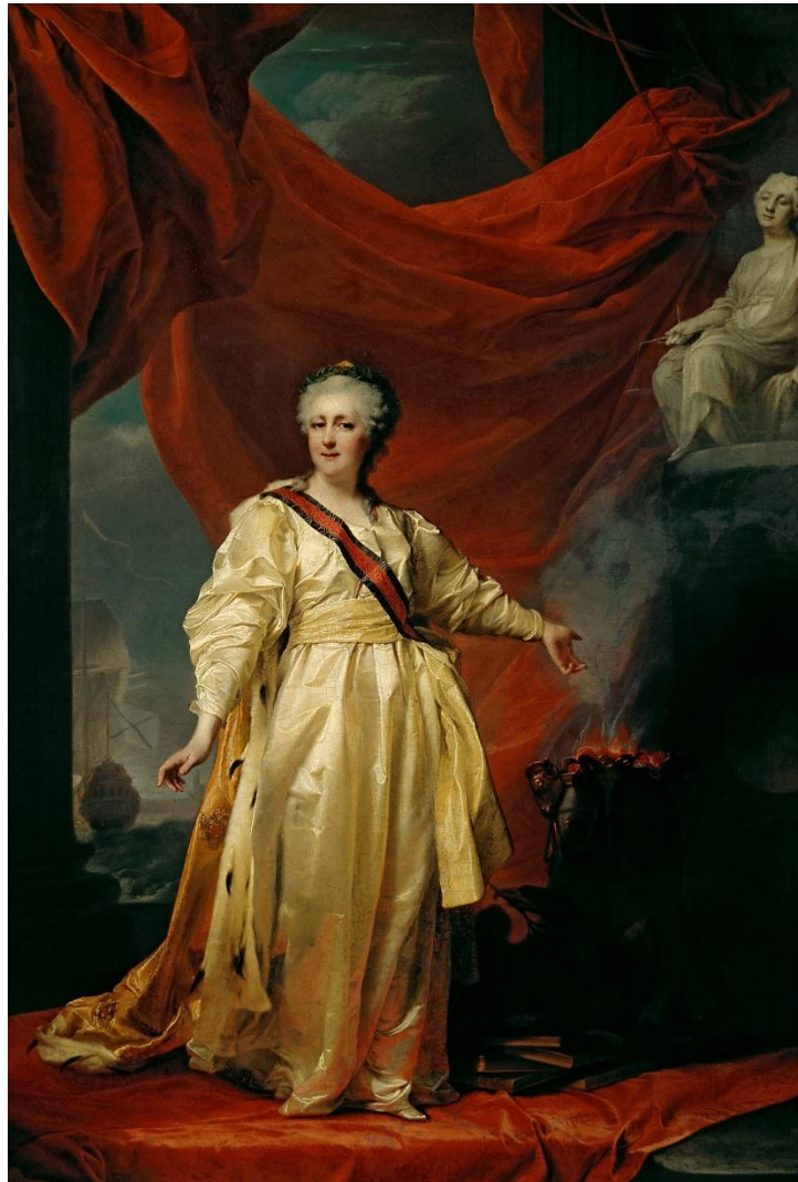
Д.Г. Левицкий. «Екатерина II – законодательница в храме Правосудия» (1783)

разумных законов для достижения «общего блага». Екатерина активно культивировала этот образ, состоя в переписке с Вольтером и Дидро и позиционируя себя как «философа на троне». Однако на практике ее правление представляло собой сложный симбиоз передовых идей и консервативной социальной практики, направленной на укрепление самодержавия и интересов дворянского сословия.