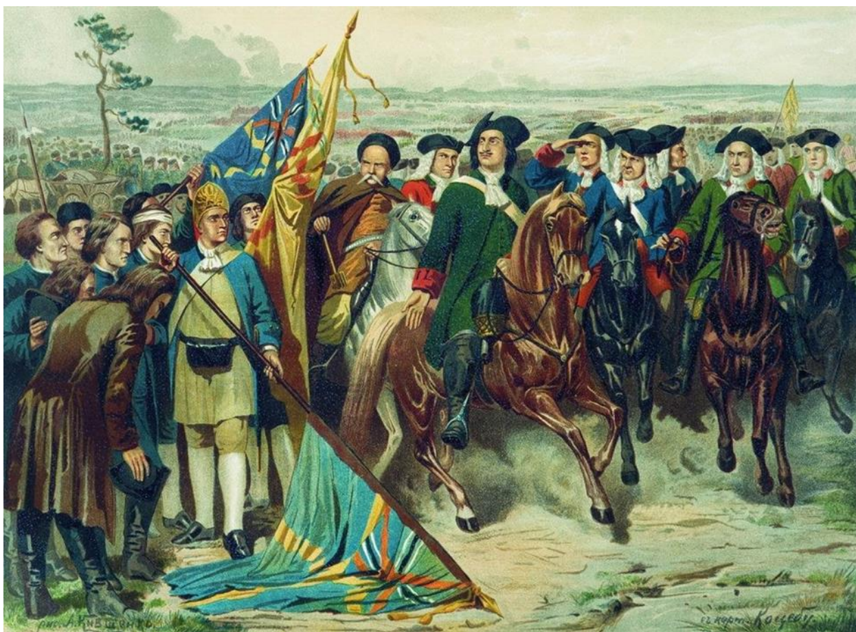
А.Д. Кившенко. «Капитуляция шведской армии» (1887)

Однако Прутский поход 1711 года показал ограниченность ресурсов России для ведения войны на два фронта. Поражение от османской армии вынудило заключить мирный договор, по которому Россия теряла Азов и лишалась права иметь флот на Черном море. Эта неудача временно отодвинула решение черноморской проблемы.