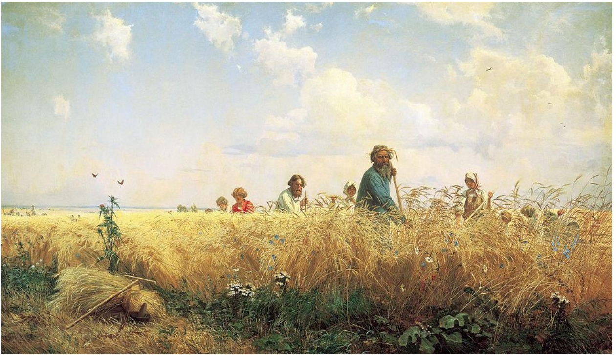
Г.Г. Мясоедов. «Страдная пора (Косцы)» (1887)

Крестьянская реформа 1861 г. представляла собой фундаментальную трансформацию аграрных отношений в Российской империи, оказавшую долгосрочное воздействие на развитие сельскохозяйственного сектора. Данная реформа, направленная на ликвидацию крепостной зависимости, стала ключевым элементом модернизации экономики страны, обусловленной как внутренними потребностями, так и внешними вызовами, включая технологическое отставание, продемонстрированное в ходе Крымской войны.