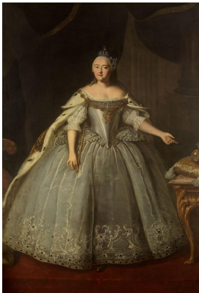
И.Я. Вишняков. Портрет императрицы Елизаветы Петровны (1743)

Экономические преобразования и их влияние на аграрный сектор. Значительную роль в экономической политике периода правления Елизаветы Петровны сыграл П.И. Шувалов. Ключевыми преобразованиями стали: ликвидация внутренних таможенных пошлин (1753), способствовавшая созданию единого экономического пространства; создание Дворянского и Купеческого банков (1754), упорядочившее кредитную систему; введение протекционистского таможенного тарифа для защиты отечественного производства.