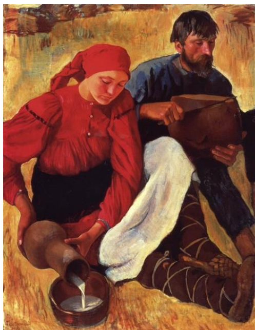
З.Е. Серебрякова. «Крестьяне» (1914)

На начальном этапе военных действий недостаточно продуманная мобилизация трудоспособного мужского населения привела к серьезным экономическим последствиям: сбор зерновых в аграрных регионах сократился на 30%, а промышленный сектор столкнулся с острым дефицитом рабочей силы. Кризисная ситуация осложнялась неудовлетворительным состоянием транспортной инфраструктуры, которая не справлялась даже с вывозом зерна из сибирских и уральских регионов. Одновременно отсутствие организованного контроля за миграционными процессами вызвало массовое перемещение беженцев (свыше 2 млн человек) и дезертиров (примерно 200 тыс.) в период с августа 1914 г. по март 1917 г.