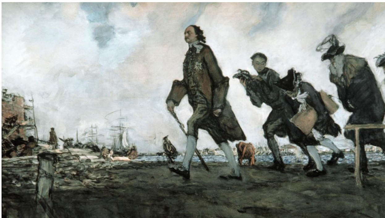
В.А. Серов «Пётр I» (1907)

При этом Москва сохранила значение важного идеологического и религиозного центра. Историческая столица оставалась символом национальных традиций и духовным сердцем страны, что обеспечивало преемственность в процессе модернизации. В Москве продолжали короноваться императоры, здесь располагались основные религиозные святыни и сохранялись традиционные формы общественной жизни.