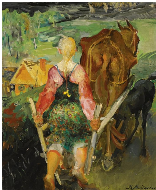
Ф.А. Малявин. «Пахота» (1910)

Первый законодательный акт отменял выкупные платежи и предоставлял крестьянам право выхода из общины с закреплением в частную собственность отдельных земельных наделов. Второй документ устанавливал автоматический переход к частному землевладению в общинах, где не проводились переделы земли. Третий законодательный акт регламентировал процедуру землеустройства, позволяя формировать целостные земельные участки (отруба) как для коллективных, так и для индивидуальных хозяйств, что было направлено на ликвидацию чересполосицы и предоставление крестьянам права частной собственности на землю.