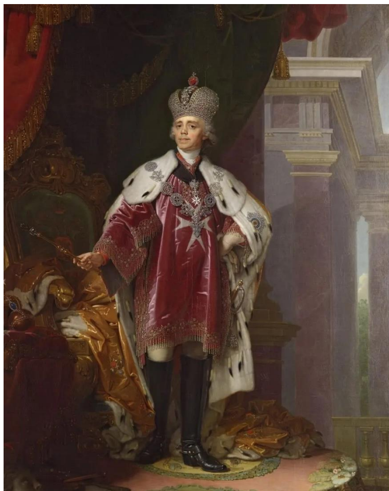
В.Л. Боровиковский. «Портрет императора Павла I в костюме гроссмейстера Мальтийского ордена» (1800)

отношений через издание четких, детализированных и обязательных для всех сословий законов. Император, видевший в произволе и вольностях дворянства главную угрозу российской государственности, стремился ограничить сословные привилегии, дарованные его предшественниками, и поставить все социальные группы в равное положение перед верховной властью монарха. Его идеалом была не сословная монархия, основанная на договоре с элитой, а военно-бюрократическая империя с жесткой вертикалью управления.