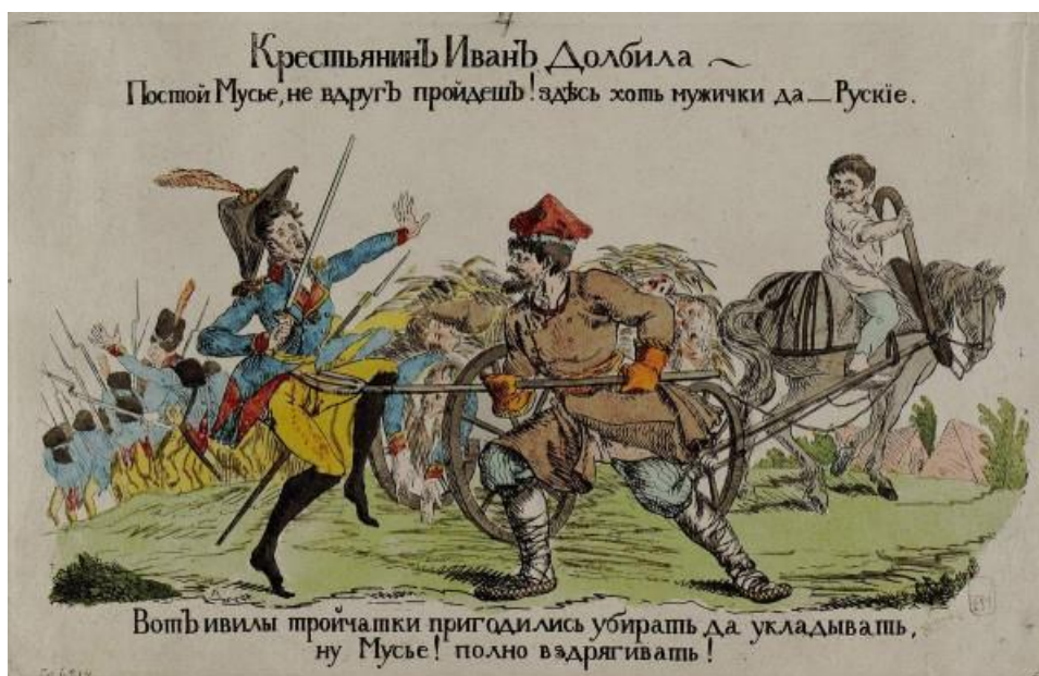
А.Г. Венецианов. «Крестьянин Иван Долбила» (1812)

Участие России в антинаполеоновских коалициях и последующее противостояние с Францией оказало двоякое влияние на экономику. Согласно положениям Тильзитского мира 1807 г. Россия присоединилась к континентальной блокаде против Великобритании, что нанесло тяжелейший удар по аграрному экспорту. Англия была главным покупателем российского сырья: леса, пеньки, льна, сала и хлеба. Закрытие этого рынка привело к падению цен на сельскохозяйственную продукцию внутри страны и сокращению доходов как помещиков, так и государственной казны. Одновременно происходил рост недовольства среди дворянства, чье благосостояние напрямую зависело от продажи продукции с вотчин, и наблюдался расцвет контрабандной торговли, в которую были вовлечены русские купцы и помещики, желавшие сбыть товар. Этот экономический кризис стал одной из ключевых причин нарастания противоречий между Россией и Францией и подтолкнул правительство Александра I к подготовке к новой войне.