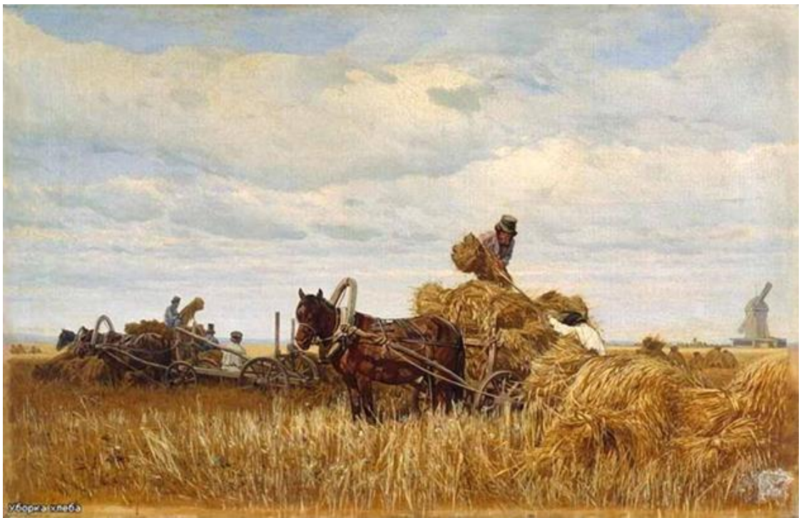
П.Н. Грузинский. «Уборка хлеба» (1883)

Весьма успешными оказались реформы в Прибалтике (1804-1819 гг.). В остзейских губерниях был реализован двухэтапный проект: 1) сначала в 1804-1805 гг. произошло закрепление права крестьян на наследственное владение землей и регламентация их повинностей; 2) затем в 1816-1819 гг. состоялась отмена личной крепостной зависимости при сохранении всей земли в собственности дворянства. Этот «региональный эксперимент» показал возможные пути решения аграрного вопроса, но его распространение на всю Россию было заблокировано сопротивлением консервативного дворянства.