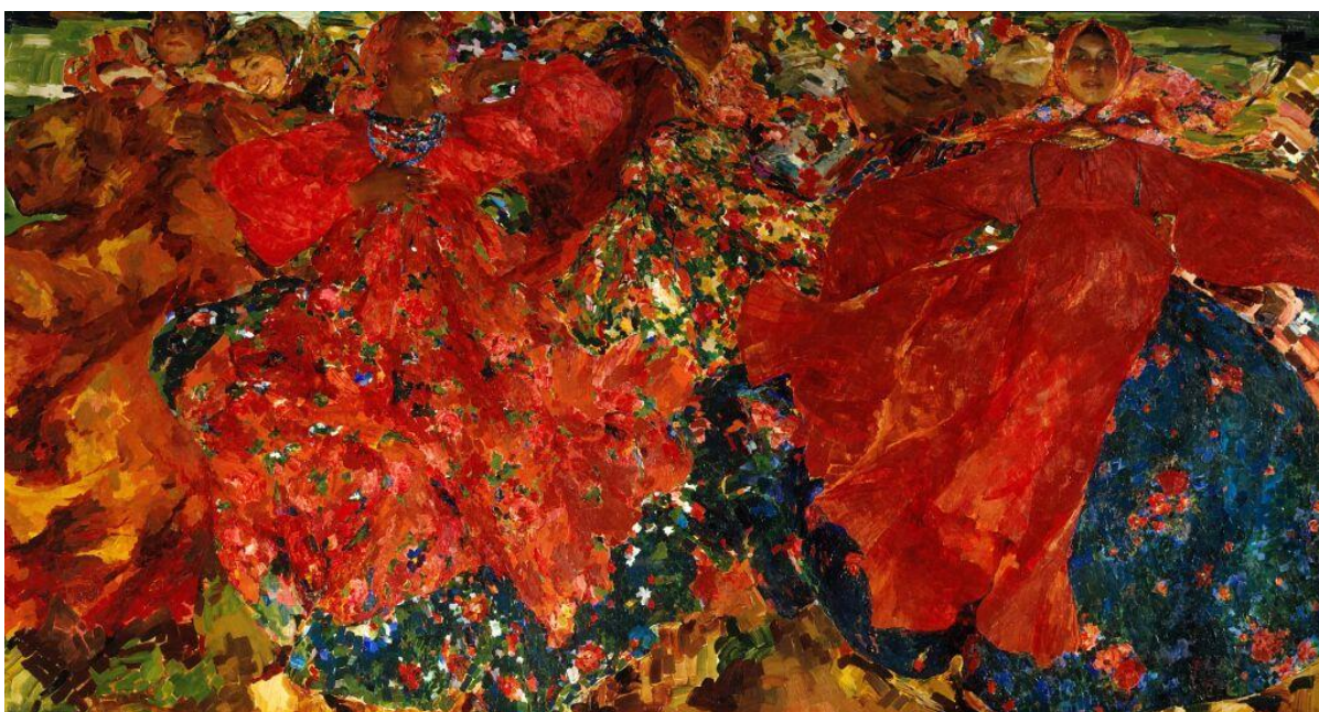
Ф.В. Малявин. «Вихрь» (1906)

Завершение и итоги Первой русской революции. Завершение Первой русской революции в 1907 г. способствовало снижению остроты системного кризиса в стране и прекращению масштабных социально-политических выступлений, в которых ведущую роль играли крестьяне, рабочие и военнослужащие. Итоги революции не только определили новые векторы развития российского государства, но и создали предпосылки для формирования двойственной политической ситуации: с одной стороны, был достигнут временный внутривластный компромисс, с другой – заложены основы для будущего противостояния между верховной властью и разнородными политическими силами, представленными в Государственной Думе.