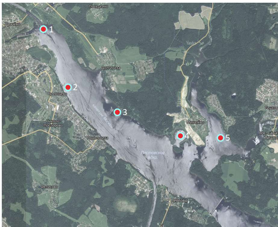
Рисунок 1. Пестовское водохранилище. Кругами обозначены станции отбора проб.

В зависимости от таксономической группы беспозвоночных определяли до уровня вида, рода, семейства, отряда или класса. Определение видового состава организмов выполняли под микроскопом Микромемед MC-4-ZOOMLED с помощью определителей [7, 8].